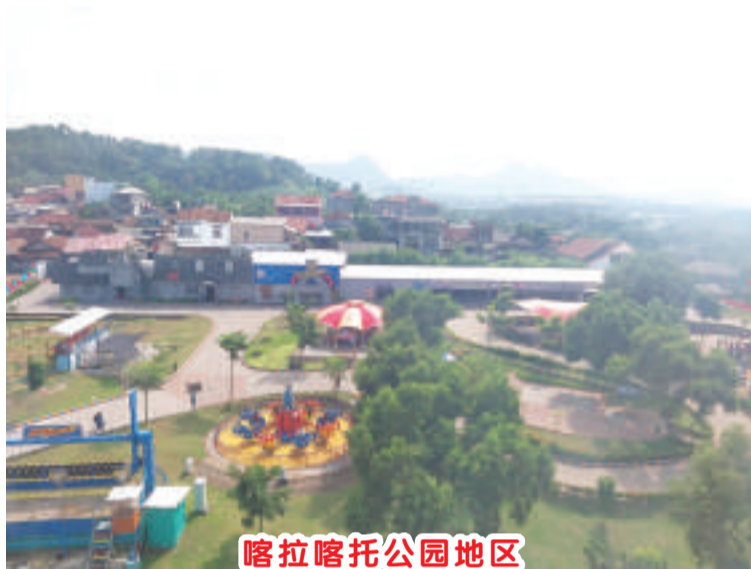
喀拉喀托公园地区