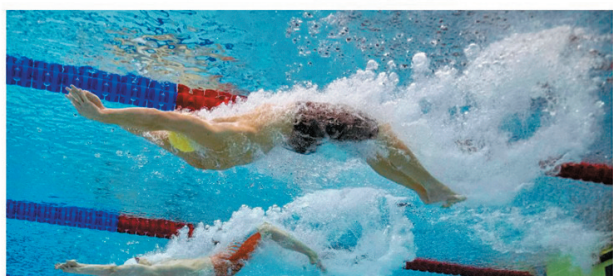
◆《紐約時報》4月指23名中國游泳選手在東京奧運前7個月藥檢呈陽性反應。