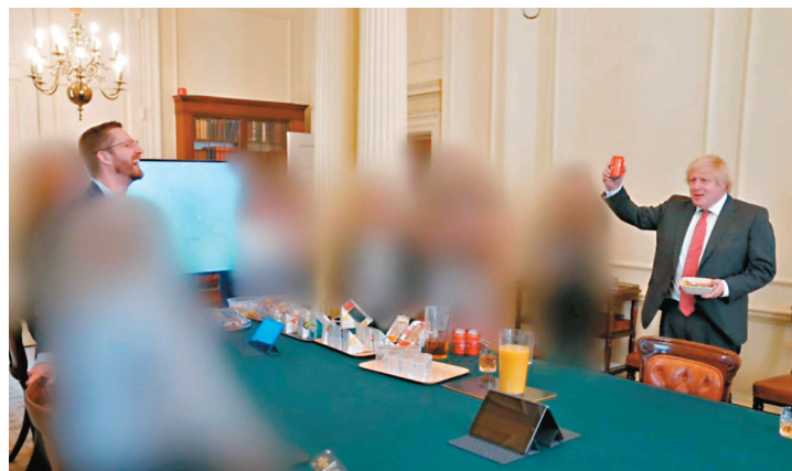
◆約翰遜(右)在新冠疫情期间，多次違反防疫限聚令。