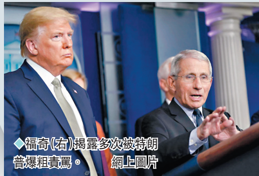
◆福奇(右)揭露多次被特朗普爆粗責罵。

根據《華盛頓郵報》取得新書節錄，福奇在回憶錄中指出，2020年11月1日，距離大選剩下倒數兩天，周日早晨9時30分接到特朗普的來電。特朗普在電話中對福奇爆粗說：「我真的喜歡你，但你×××在幹什麼？」特朗普對福奇感到惱怒的原因是，福奇接受《華盛頓郵報》訪問時對確診案例再次增加提出警告，呼籲全國民眾應該立即採取行動以挽救人命。福奇受訪時表示，特朗普在大選造勢場合支持者爆滿，絕大多數人未戴口罩，恐讓病毒迅速傳播。大約100萬名美國人在新冠疫情爆發後死亡。福奇在書中寫道，第一次與特朗普見面是2019年9月，當天特朗普簽署行政命令要求流感疫苗製造商增加產量，不過特朗普私下對福奇說，出任總統之前不曾打過流感疫苗，「因為根本沒必要」。