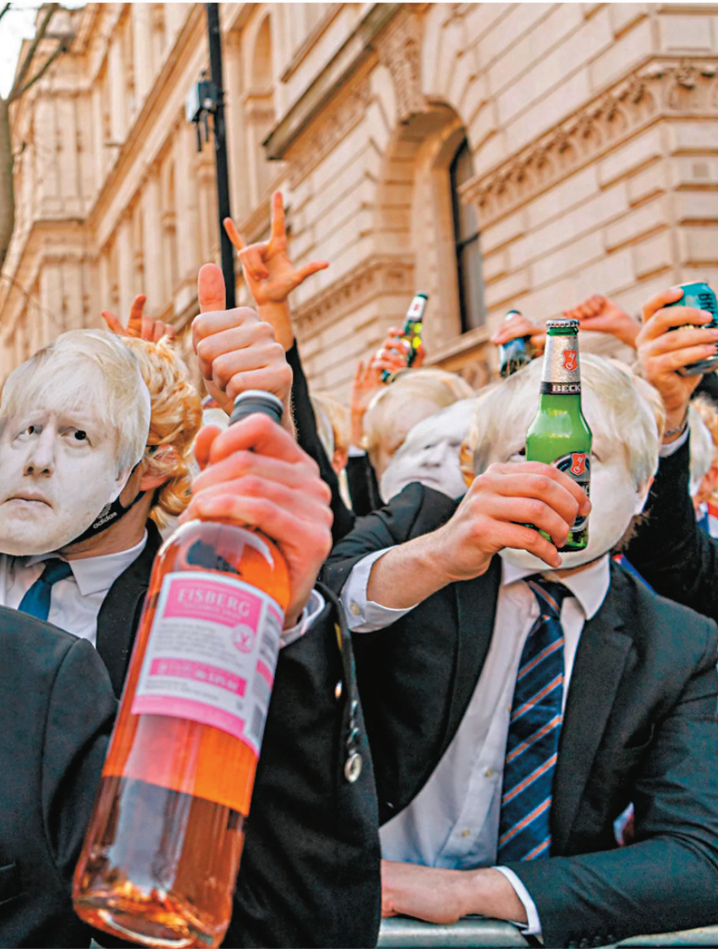
▲「派對門」事件激起民憤，抗議人士戴上約翰遜面具大肆嘲諷。

回憶錄中指出，特朗普2020年6月致電福奇時破口大罵，因為福奇接受美國醫學會期刊訪問時坦承，新冠疫苗效力能維持多久仍不確定，可能每年需要再打疫苗。福奇的訪問見報後造成股市下跌，特朗普在電話中破口大罵福奇「害整個國家損失×××1兆美元」。