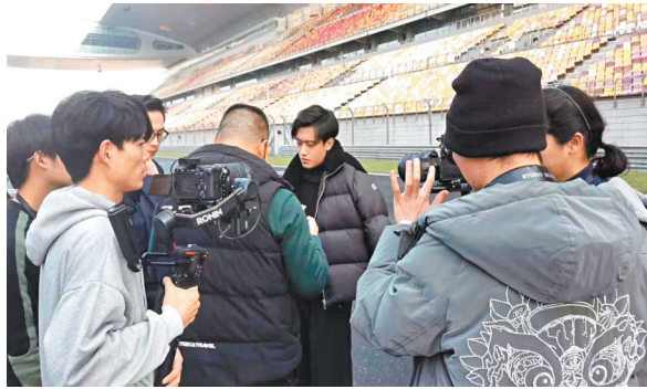
▲周冠宇在上海國際賽車場參與紀錄電影拍攝。

不僅如此，要呈現周冠宇完整的成長歷程，不僅有F1，還有F4、F3、F2……這些所有的比賽畫面都需要逐個甄選、確認。