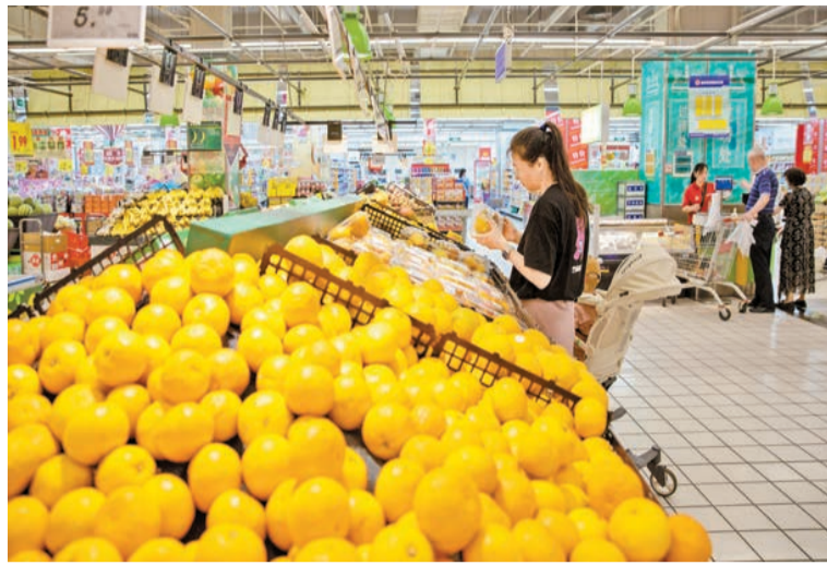
消費者在超市內選購水果。

從環比看，5月份PPI由上月下降0.2%轉為上漲0.2%，改變了前6個月連續下降趨勢。其中，生產資