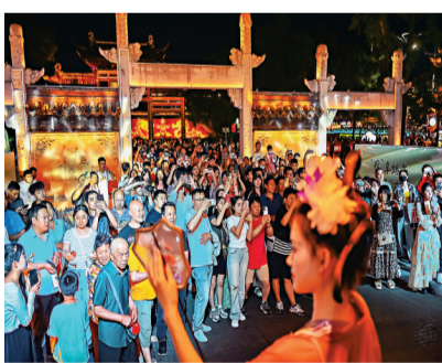
◆6月10日，江蘇南京，遊客們在夫子廟廣場上欣賞文藝表演。

遊客越來越偏愛選擇靈活、個性化的出遊方式，在慢節奏旅行、深入體驗、放鬆休閒中享受生活。雲南、青海、甘肅、內蒙古、貴州等地成為年輕人自駕遊、避暑遊的熱門選擇。