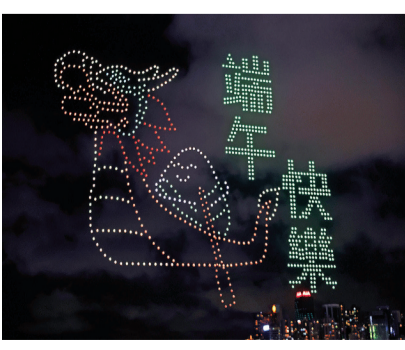
◆10日晚，無人機在維港夜空拼出糉子划龍舟等動態圖案。

6月15日起由上海虹橋開往香港西九龍的D907/908次動臥列車將正式上線運行，滬港間實況夕發朝至，香港與內地間人員往來將更加便利。中國鐵路上海局集團有限公司上海客運段選拔3名列車長、14名列車員擔當進港動臥列車乘務工作，並在近日開展了進港動臥乘務指導、進港票務業務處置、粵語服務用語等內容培訓。