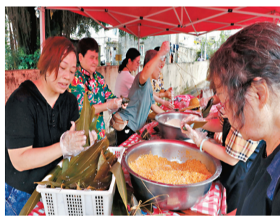
◆活動安排來賓親手包糉子，感受端午民俗。

在秭歸，包糉也有講究。屈原一生淡泊明志、忠誠赤膽、高潔如玉，屈鄉由此流傳一首《糉子歌》，講包糉也要「有稜有角，有心有肝，一身潔白，半世熬煎」。秭歸還有「寧荒一年田，不輸一年船」的說法，忙完夏收的農民、回鄉的青年踴躍參賽，百姓觀看龍舟競渡既為了奪標榮譽和豐收寓意，更為了傳承「吾將上下而求索」的屈原精神。