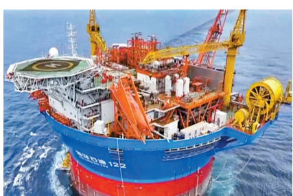
◆6月10日，「海葵一號」在珠江口盆地的流花油田安家落戶。

由於特殊的圓筒型結構，「海葵一號」重心高、穩定性差，浮於海面極易發生旋轉。任憑6月初的廣東海域風浪乍起，亂流湧動，