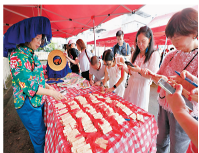
◆來賓在牌上寫下祈福字句。