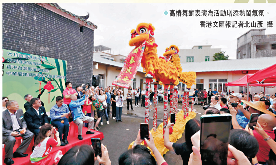
◆高樁舞獅表演為活動增添熱鬧氣氛。

據介紹，廖萬石堂始建於雍正初年，並於乾隆年間重修，屬三進兩院式建築。廖萬石堂於1985年被列為古蹟，於2021年被授予「客家文化交流香港基地」。