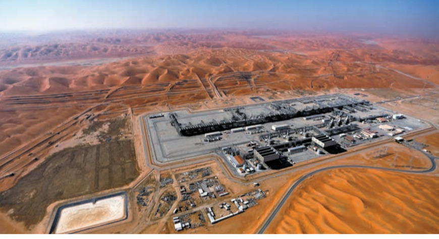
由於來自石油的收入不斷減少，沙特GDP已連跌三季。

【香港商報訊】據路透社9日報道，沙特第一季實際GDP按年減1.7%，主要是受到石油活動持續下降影響。統計總局的估計顯示，第一季石油活動GDP較上年下降11.2%，而非石油活動GDP較去年同期增長3.4%，政府GDP活動則增長2%。官員解釋，石油活動GDP大跌，主要是受到石油產量削減和油價下跌的影響。沙特GDP已連跌三季，2023年第四季，該國GDP萎縮3.7%。