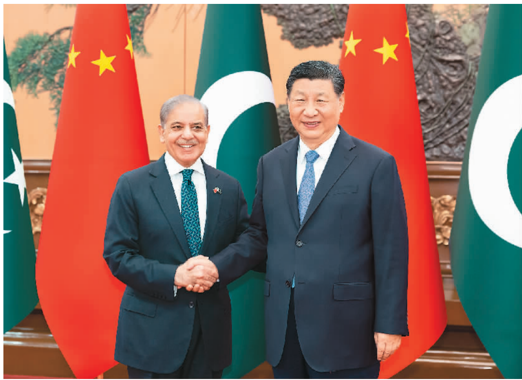
六月七日下午, 国家主席习近平在北京人民大会堂会见来华正式访问的巴基斯坦总理夏巴兹。