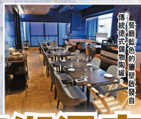
餐廳藍色的牆壁散發出傳統德式備物陶罐。