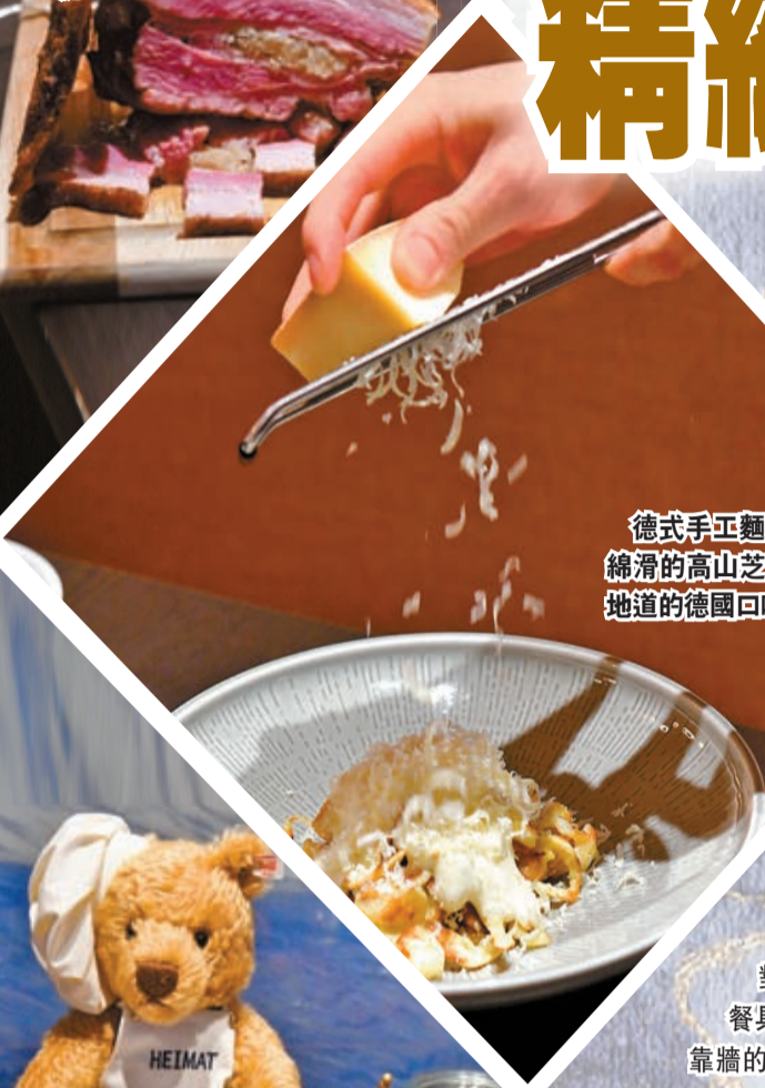
德式手工麵筋搭配口感綿滑的高山芝士泡沫，最地道的德國口味。