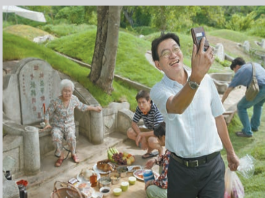
電影以泰籍華人為背景，會有掃墓祭祖的畫面出現。