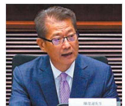
◆陳茂波預料,香港經濟在今年餘下時間應會錄得進一步增長。

香港經濟在今年第一季按年溫和增長2.7%,是連續第五個季度實現正增長。第一季訪港旅客增加至近1,123萬人次,受惠於訪港旅客人次持續回升,服務輸出在第一季仍然是經濟增長的重要動力,按年實質顯著增長8.4%。陳茂波預計,訪港旅遊業進一步復甦應會支持服務輸出,若外部需求繼續向好,貨物出口亦會進一步改善,但須留意地緣政局