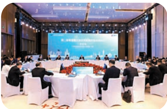
◆第二屆粵港澳大灣區民航高質量發展會議現場。

粵港澳大灣區機場去年共完成旅客吞吐量1.8億人次,貨郵吞吐量803萬噸,飛機起降128.4萬架次,發展空間持續拓展。但由於產權歸屬、利益主體、運行標準、定位分工等多方面原因,大灣區機場發展趨同、空域資源緊缺、保障能力不足、協同機制不暢等問題依然突出。