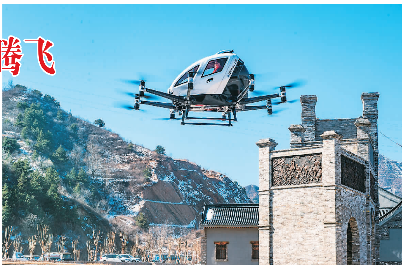
▲ 在山西省晋中市左权县桐峪1941小镇，无人驾驶“空中的士”于今年2月成功完成低空飞行观光试航。

根据测算，2026年中国低空经济规模有望突破万亿元。“低空+观光旅游”“低空+物流运输”“低空+城市治理”等应用形式，越来越多地出现在人们身边。