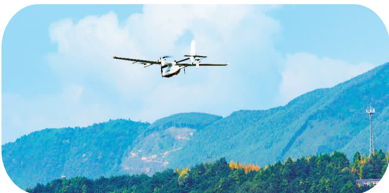
▲ 江西省宜春市奉新县，成都纵横大鵬无人机科技有限公司生产的无人机搭载激光雷达，采集位于奉新县风场选址的1:2000点云成果。