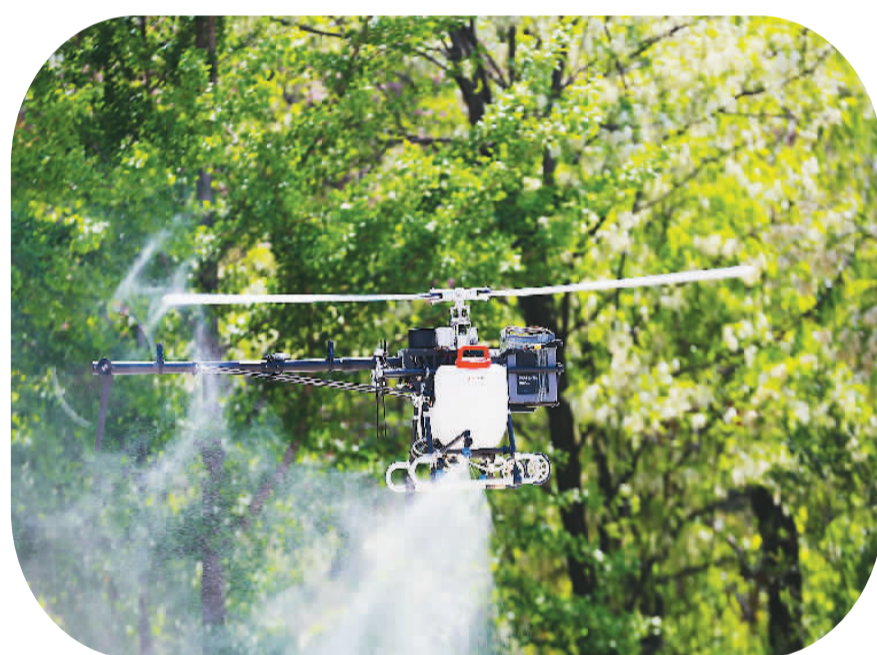
▲ 在辽宁省沈阳市无距科技有限公司内，农业X60无人植保直升机正在作业。