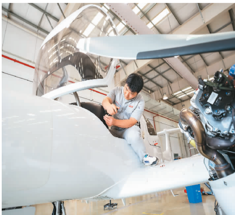
▲ 近年来，安徽省芜湖市大力发展低空经济，目前已聚集产业链上下游企业近200家。图为工作人员在芜湖航空产业园内作业。