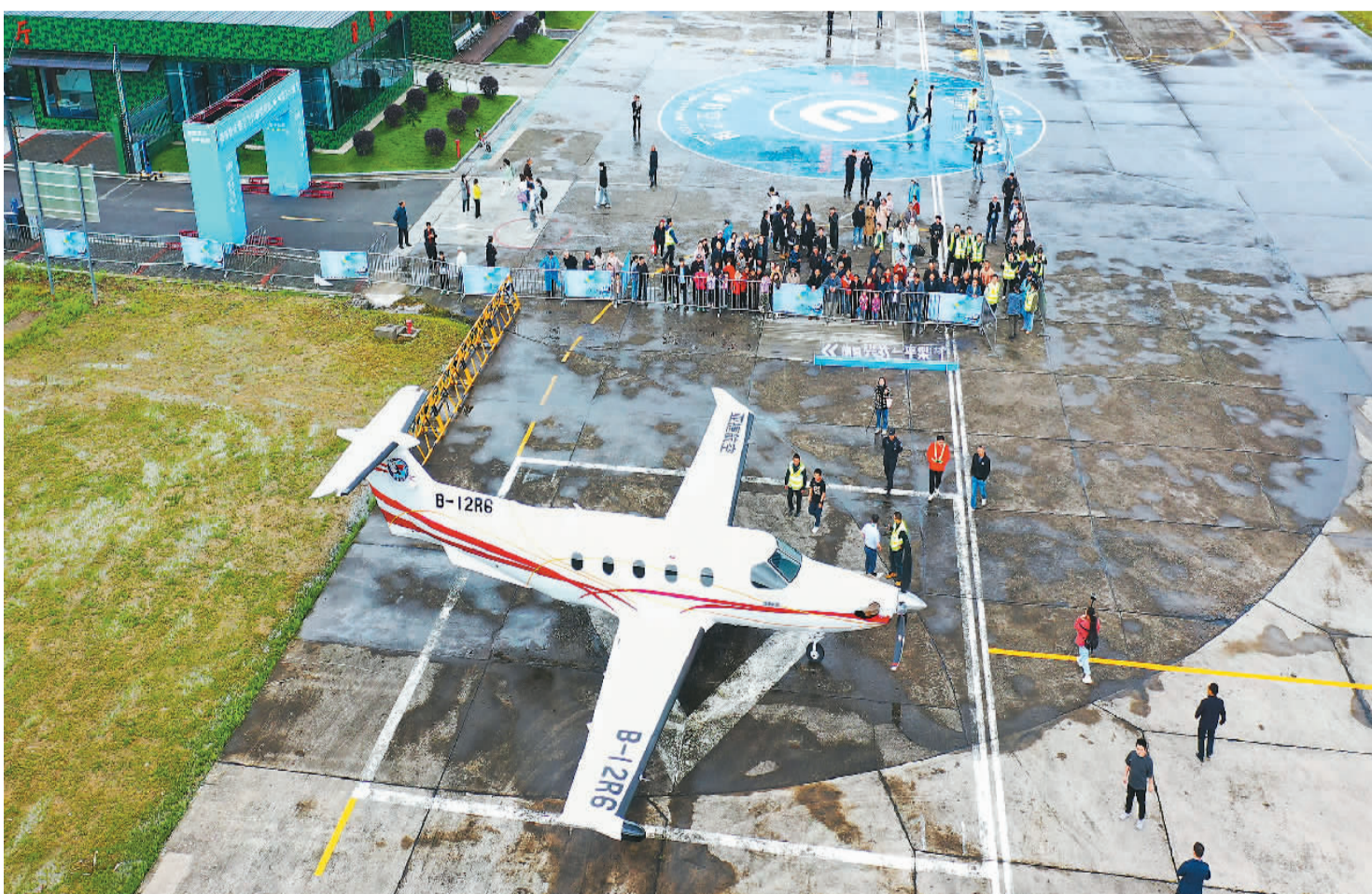
▲ 近日，重庆市梁平区举行首届重庆低空飞行消费周梁平分会场暨2024梁平低空云夏节活动。图为重庆梁平机场内，市民和游客正在等候登机，体验低空观光游览。