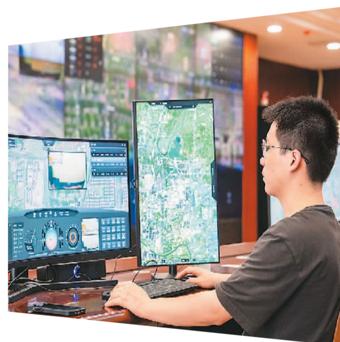
▲ 在湖南省长沙县低空经济应用场景监控指挥中心，技术人员远程控制无人机起降和监控飞行安全。