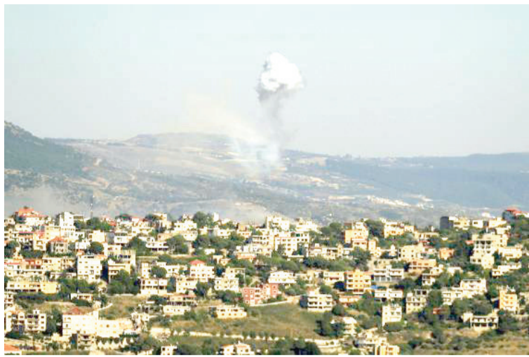
6月2日,在黎巴嫩基亚姆,以军轰炸引发浓烟滚滚。

新华社北京6月4日电 以色列媒体3日报道,黎巴嫩真主党向以色列北部发射火箭弹,导致当地山火蔓延,参与救火的6名以军士兵受轻伤,多处民宅起火。黎巴嫩真主党证实发射“喀秋莎”火箭弹和自杀式无人机编队,以回击以军先前在黎境内的刺杀行动。