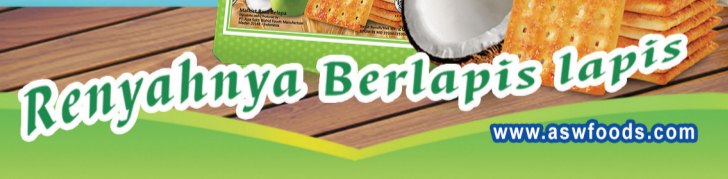
最佳餅干 Renyahnya Berlapis lapis www.aswfoods.com