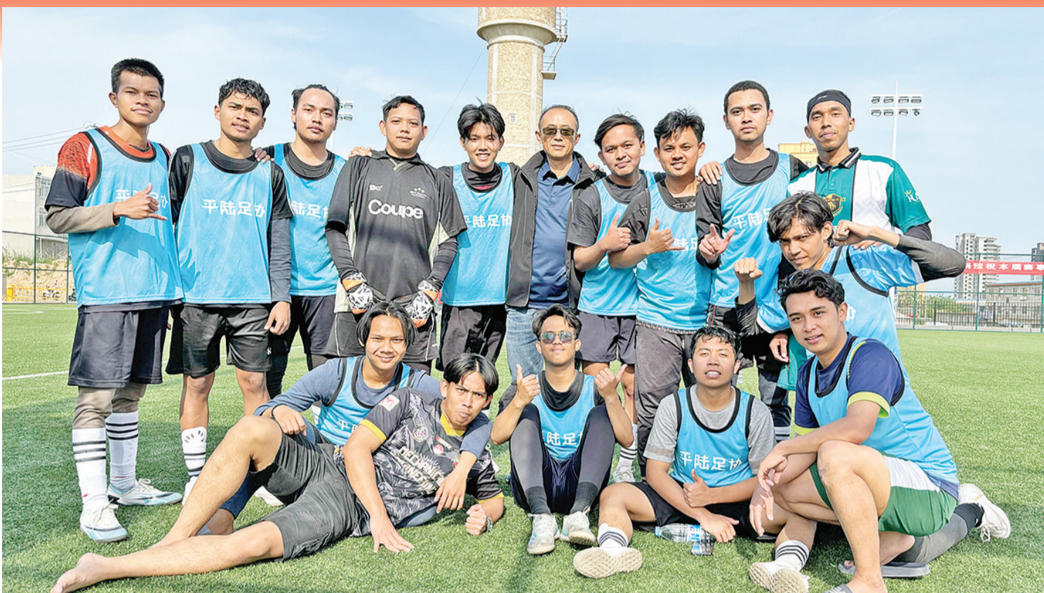
4月28日,印尼学生在山西平陆参加足球赛后合影。