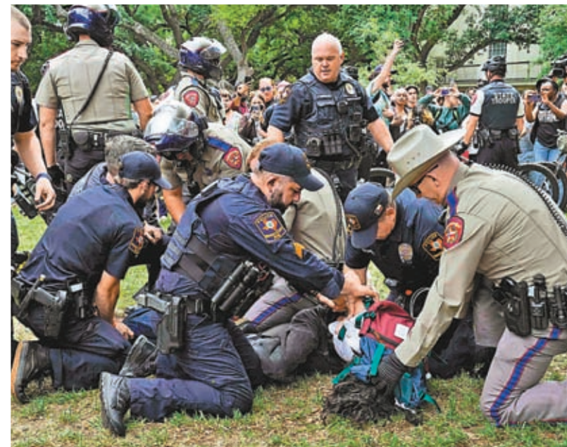
▲一名奧斯汀分校的撐巴示威者被捕。 資料圖片