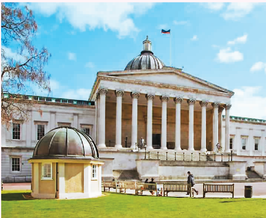
英国伦敦大学学院教学楼。

在申请英国本科时，学生需要了解关键的申请注意事项。首先，A-Level课程、IB（国际文凭）和AP（大学先修课）课程是主要的课程体系。A-Level课程相当于国内的高考，可用于申请英国的所有大学，包括G5院校（牛津大学、剑桥大学、帝国理工学院、伦敦政治经济学院、伦敦大学学院）。IB课程虽然录取人数较少，但同样为申请英国本科提供了一条有效途径。此外，英国本科留学还提供了多种升学途径，如高考成绩直接申请、预科课程、国际大一等过渡性课程，为学生提供了更加灵活多样的选择。