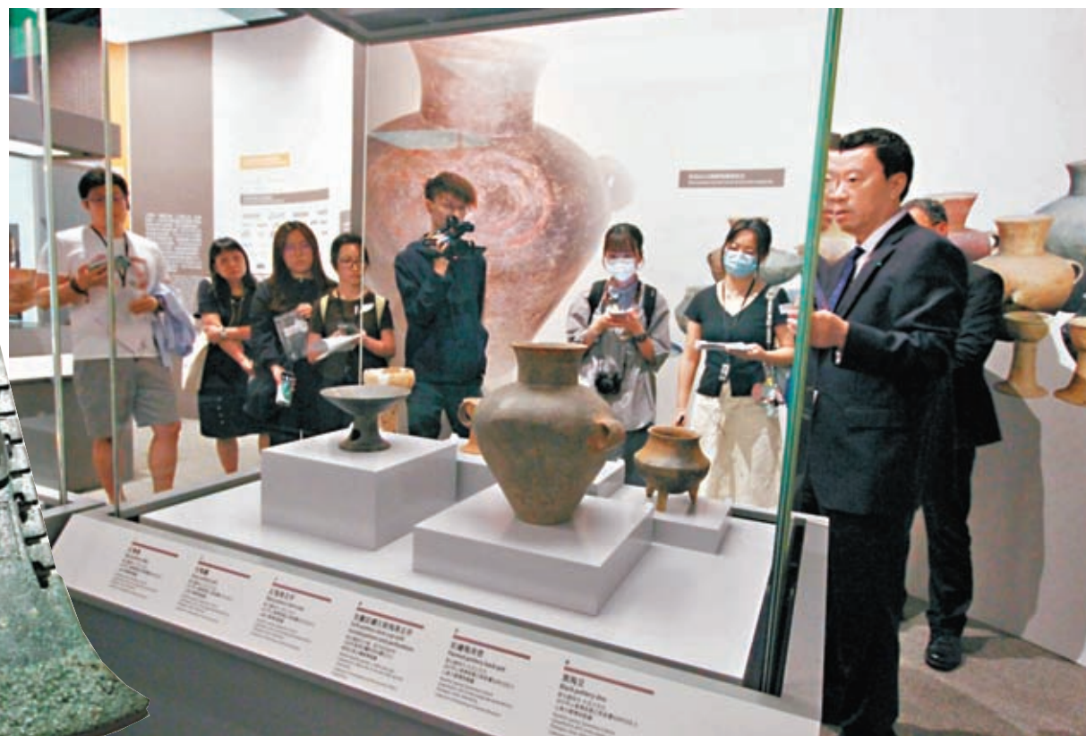
◆「禮樂和合探知齊魯——山東文物特展」29日起於香港文物探知館免費展出，展出共60套（約200件）精選的山東文物。