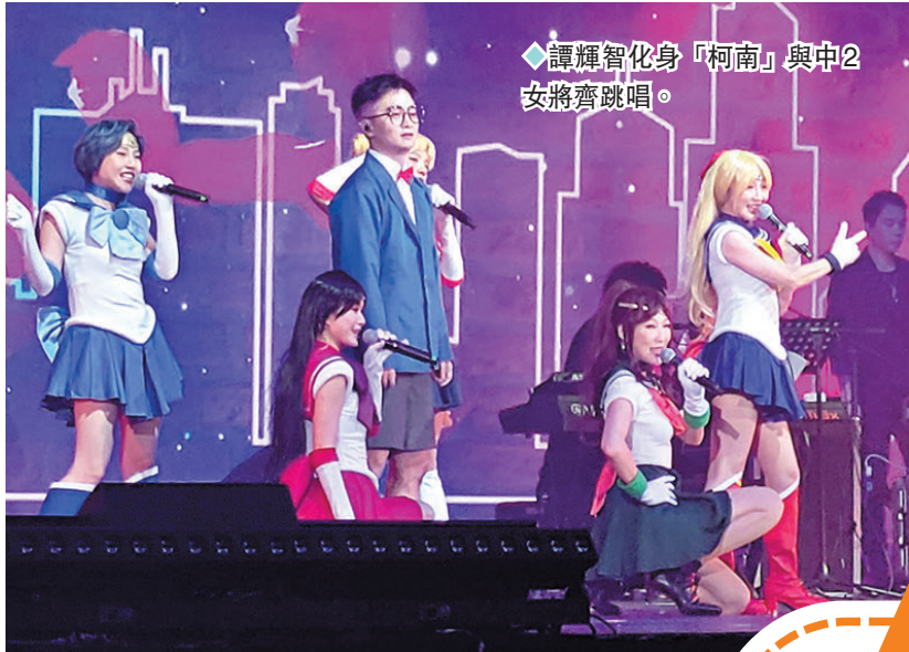
◆譚輝智化身「柯南」與中2生將齊跳唱。