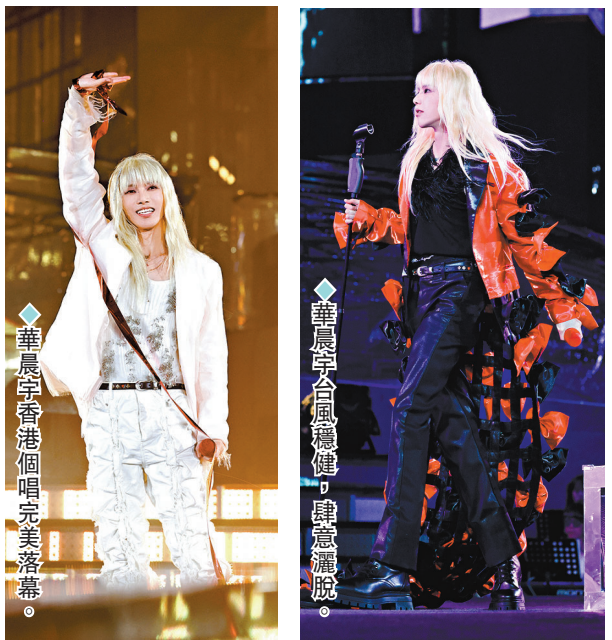
◆華晨宇香港個唱完美落幕。

粉絲們紛紛表示:「意猶未盡」「戒斷反映強烈」「很難忘的三天,香港真的超級棒!」「那個繁榮開放的香港又回來了!」在霓虹都市中屬於「火星人」的狂歡雖已落幕,雨會停,天會晴,期待在四時流轉中與華晨宇的再次相逢。