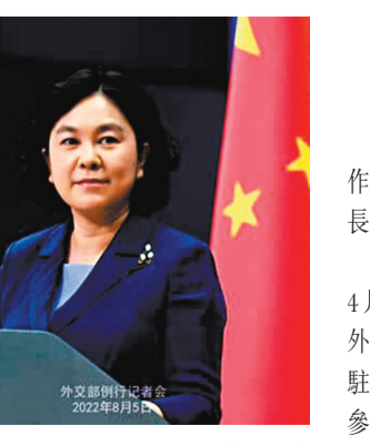
◆中國國務院27日任命華春瑩為中國外交部副部長。 資料圖片