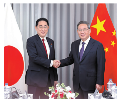
◆李強會見日本首相岸田文雄。

李強指出，中日經濟互補優勢將長期存在，在科技創新、數字經濟、綠色發展、開拓第三方市場等方面還有巨大合作潛力。雙