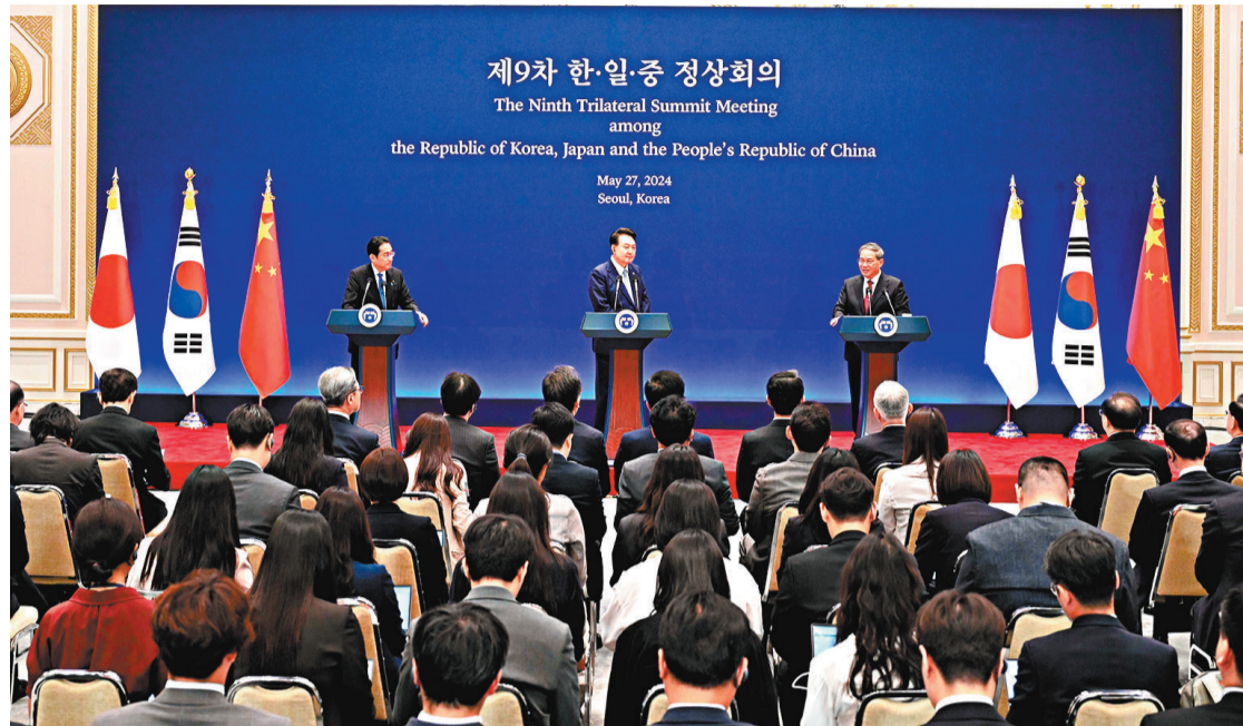
◆當地時間5月27日上午，中國國務院總理李強在首爾與韓國總統尹錫悅、日本首相岸田文雄共同出席第九次中日韓領導人會議。這是會後，三國領導人共同會見記者。

會後，三國領導人共同會見記者。李強表示，面對新挑戰、新機遇，中日韓合作要展現新擔當、新作為。中方願以此次領導人會議為契機，同韓方、日方一道，推動中日韓合作行穩致遠。三方發表《第九次中日韓領導人會議聯合宣言》《中日韓知識產權合作十年願景聯合聲明》《關於未來大流行病預防、準備和應對的聯合聲明》，一致同意致力於落實第八次領導人會議通過的《中日韓合作未來十年展望》，推動中日韓三國合作機制化，在東盟與中日韓等多邊框架內保持密切溝通合作，共同維護世界和平穩定與發展繁榮。三方同意將2025-2026年定為中日韓文化交流年。