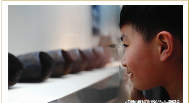
参观武王墩出土编钟