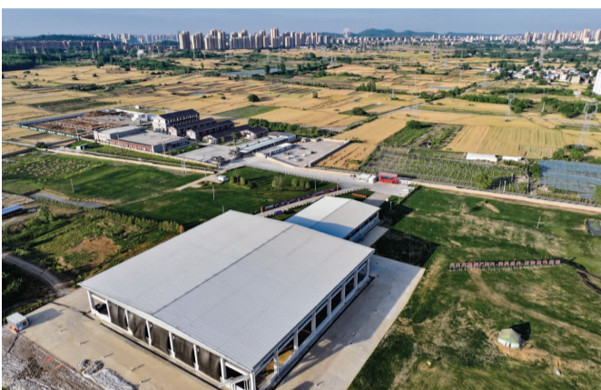
航拍的武王墩考古发掘现场。