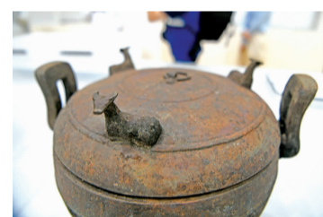
卧牛钮铜鼎

专家介绍,雄踞江淮流域数百年,楚国掌控着极为丰富的铜矿资源,并在青铜礼器的铸造上达到了极高的水平。楚国青铜器不仅拥有中原礼器庄重、严肃的特点,又拥有诸多创新元素,发展出自成一派的风格。 晋文婧 张理想