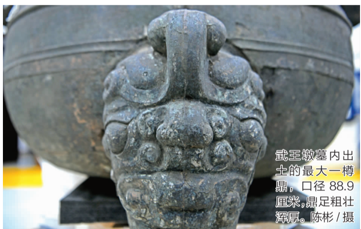
武王墩墓内出土的最大一樽鼎,口径88.9厘米,鼎足粗壮浑厚。

经初步考古发掘,武王墩一号墓规模巨大、内涵丰富,采用楚国最高等级的丧葬礼制。武王墩一号墓封土底部直径超过130米,墓口开口边长约51米,墓坑底部面积超过400平方米,是已发掘楚墓中最大的一座,且具有极为复杂的多重棺椁结构,是目前中国首次见到的、结构清晰明确的九室楚墓。 柏松