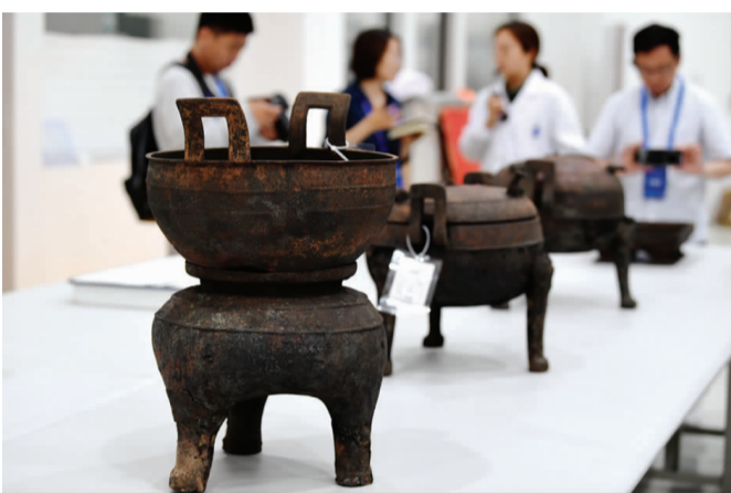
考古人员向记者介绍出土的青铜器。