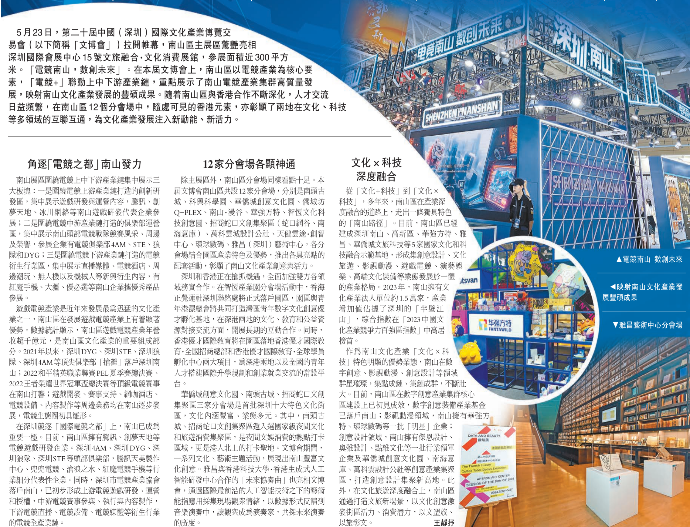
▲ 電競南山 數創未來