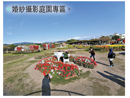
◆婚紗攝影庭園專區。

這兒不僅吸引愛花人士前往，喜好攝影的朋友也呼朋引伴，更有不少新人在此取景，園主特別在場中特設「婚紗攝影庭園專區」，新增許多歐式童話小屋、幸福涼亭、婚紗拱門、白色鋼琴等造景，讓每對新人都在藍天綠地花海中編織着愛之夢，讓大家留下此生幸福的畫面。