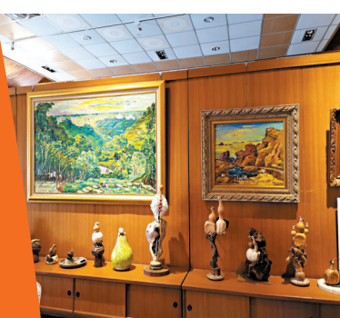
◆餐廳內外放有藝術作品。

而不油膩，皮Q肉質彈牙，入口散發淡淡的碳烤香！蝦片搭豬腳肉撕綴以蔥粒大口吃，別有滋味！「西班牙焗烤大蝦」一道令人難以抗拒的菜餚，端上桌已聞到撲鼻的香味，面層焗得金黃的芝士，看見就令人流口水；而「藥膳羊肉爐」材料豐富、滋補又惹味！