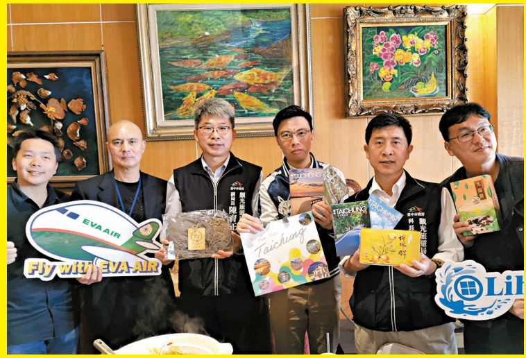
◆台中觀旅局官員和業者向來自港澳的朋友介紹豐原及后里周邊景點。