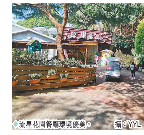
◆流星花園餐廳環境優美