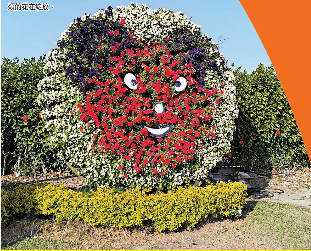
◆中社觀光花市的花卉展覽一年四季有不同種類的花在綻放。