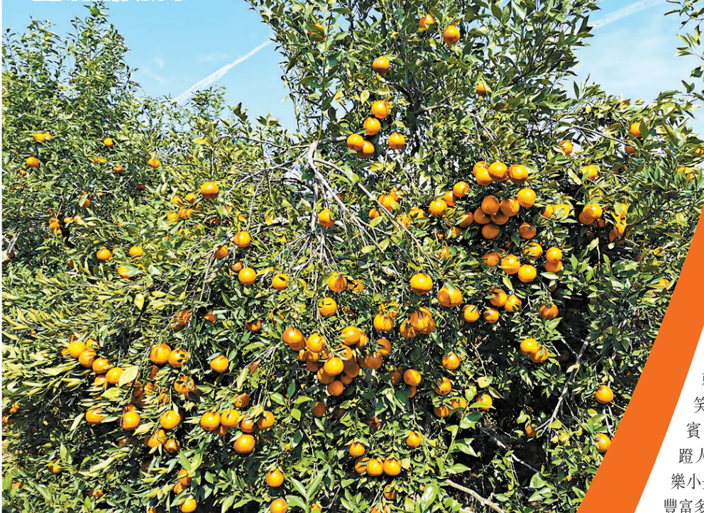
◆柑橘為果園最大宗水果。