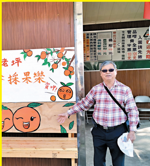
◆大家可參加雲仙谷採果樂活動。

現在，果園開放提供遊客親自採果，選擇更多樣化，一年四季都可享受採果的田園之樂。每年二至四月櫻花、桃花、李花、梅花等更盛開，彷彿花季饗宴。另外，果園也有設立涼亭式烤肉區，在烤肉同時，微風徐徐，並可俯瞰台中美麗的風景。