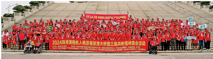
◆粵港澳三地殘疾人士登上港珠澳大橋藍海豚島。

據悉，此次活動由珠海市殘聯聯合珠海市婦女兒童福利會、香港復康聯盟、澳門明愛等開展，邀請粵港澳三地殘疾人士暢遊港珠澳大橋。三地殘疾人士登上大橋，近距離遊覽三座造型各異的通航孔橋和海底隧道，飽覽伶仃洋壯觀景象，見證大國重器的建設成就。