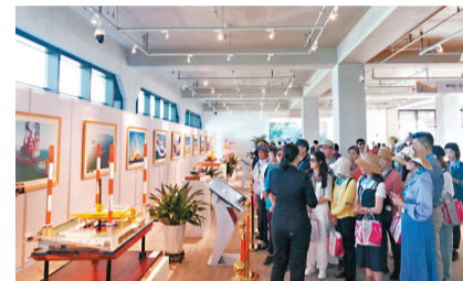
◆遊客參觀大橋開展廳。