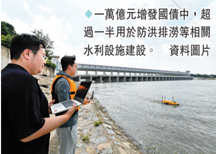
◆一萬億元增發國債中，超過一半用於防洪排澇等相關水利設施建設。 資料圖片

香港文匯報訊 據中新網報道，中國國家發展政策研究室副主任、新聞發言人李超21日透露，中國去年增發的1萬億元（人民幣，下同）國債項目進展總體順利，各地正在抓緊推動項目開工建設，截至目前，在已落地的1.5萬個項目中，已開工建設的約1.1萬個，開工率超過70%。