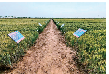
◆山東東營市墾利區永安鎮一處麥田內，52個小麥品種正在生長。

鹽鹼度為2.5‰至6‰的麥田內，近5年審定的52個小麥品種依次掛牌，不同品種的耐鹽鹼情況一目了然。