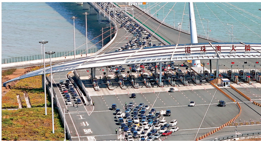
◆今年截至5月21日9時40分，經港珠澳大橋珠海公路口岸出入境旅客突破1,000萬人次。圖為港澳車輛經港珠澳大橋通關。 資料圖片

為應對快速增長的客流車流，港珠澳大橋邊檢站密切監測口岸流量，提前開通查驗通道，確保客流高峰時段及時削峰、動態削峰，最大限度提升通關效率。此外，該站不斷加強科技賦能，加快「貨車道改客車道」建設，持續更換老舊設備，優化軟件邏輯，更新完善交通流線、標識，不斷提高人員車輛通關體驗感；積極落實為民服務舉措，增派一線執勤、應急、備勤警力，引入專業志願者服務團隊，設立專業採集備案中心，部署使用手持式移動查驗設備，為旅客提供通行便利，全力保障口岸通關安全順暢。