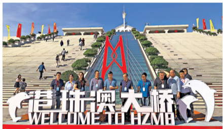
◆遊客登上大橋藍海豚島合影。