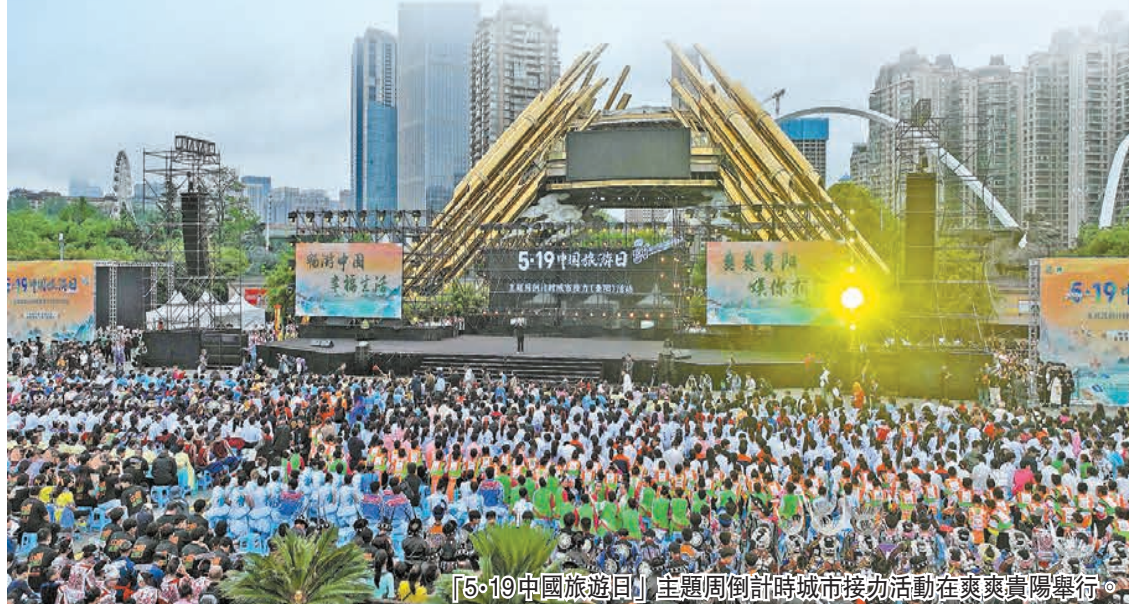
「5·19中國旅遊日」主題周倒計時城市接力活動在爽爽貴陽舉行。

在貴州「紅飄帶」長征數字科技藝術館、陽明文化園等開展特色文化研學，借力民族文化、親子遊學、邊學邊遊，打造不一樣的黔味室外「課堂」，在貴州省地質博物館感受寓教於樂，貴陽豐富的紅色文化、陽明文化、館藏文化、藝術展覽、公園空間，是親子遊娃新玩法的絕佳資源。