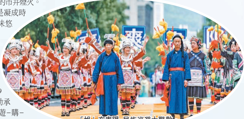
「娛」在貴陽·民族巡遊大聯歡。