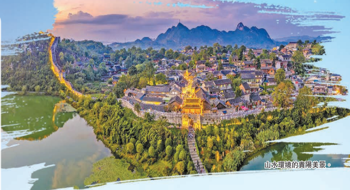
山水環繞的貴陽美景。