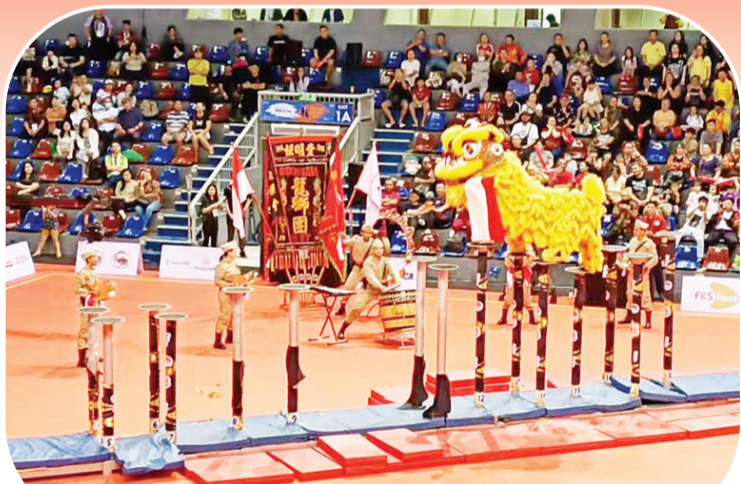
巴东恒明堂龙狮团代表队表演的爱国主题——雄狮护国旗