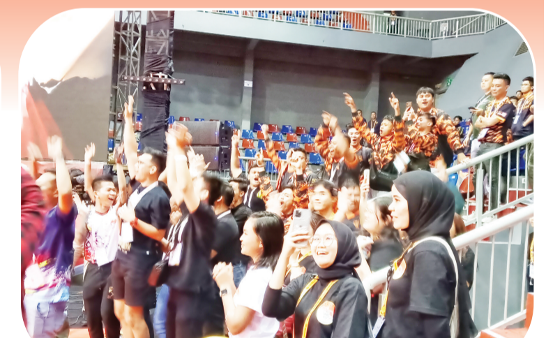
为巴东队欢呼助威的场上观众

5月19日下午,雅加达Britama Arena体育馆内,锣鼓震天,掌声雷动。首届印尼总统杯世界龙狮锦标赛在此迎来了最激动人心的时刻——高桩舞狮压轴大戏即将上演。