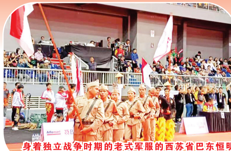
身着独立战争时期的老式军服的西苏省巴东恒明堂龙狮团队员上场