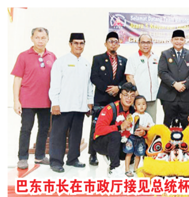
巴东市长在市政厅接见总统杯夺冠的恒明堂龙狮团运动员代表