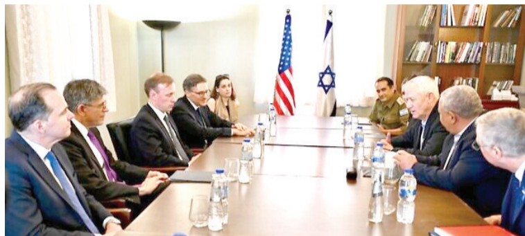
5月20日,到访的美国总统国家安全事务助理沙利文在特拉维夫与以色列国防部长加兰特等以方官员举行会谈。

【环球网报道】综合《以色列时报》《耶路撒冷邮报》报道,5月20日,到访的美国总统国家安全事务助理沙利文在特拉维夫与以色列国防部长加兰特