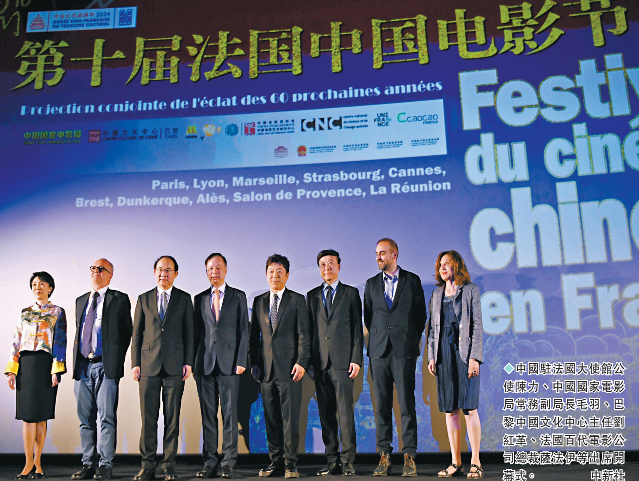
中國駐法國大使館公使陳力、中國國家電影局常務副局長毛羽、巴黎中國文化中心主任劉紅革、法國百代電影公司總裁薩法伊等出席開幕式。