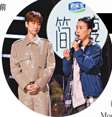
海內外歌手對賽成焦點。