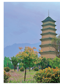
◆仙遊寺法王塔

遊寺，並建此塔。流傳至今，仙遊寺法王塔，也是現在僅存的一座隋代磚塔。唐元和元年，也就是公元806年，白居易赴任周至縣尉。有一日到訪附近的仙遊寺，夜宿寺中與人乘燭閒聊，不覺聊到五十年前玄宗李隆基和貴妃楊玉環的一段舊事。說來也巧，站在仙遊寺遙看渭水，北岸便是楊貴妃香消玉殞的馬嵬驛。情感觸發，才思大動，白居易傳世名篇、120句的長篇敘事詩《長恨歌》，此夜寫就。 山雨欲來風滿樓，當我們剛停好車，碩大的雨點就伴着滾滾雷聲密集落下。一家人索性將茶桌設在寺院一座配殿寬大的簷角下，圍爐而坐，烹水沖茶。庭前是隨處盛放的淡粉月色見草，庭中是褚黃色的7層法王塔，庭外是山嵐掩映的隱隱群峰。聽雨僧慮了，相遇在其中，倒是可遇而不可求的一場風雅。