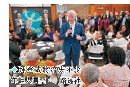
◆拜登或將流失不少年輕人選票。

法案一併綁綁通過，但許多年輕人同時反對這兩項法案。亨利指出，許多年輕人感覺到「當我們有用時，你們便利用我們，但根本不關心我們的聲音或生計。」拜登競選團隊今年入駐TikTok，但關注者不多，且留言充斥對拜登的憤怒。競選團隊使用他們認為對美國「有害」的應用程式的舉動，被民眾炮轟虛偽。