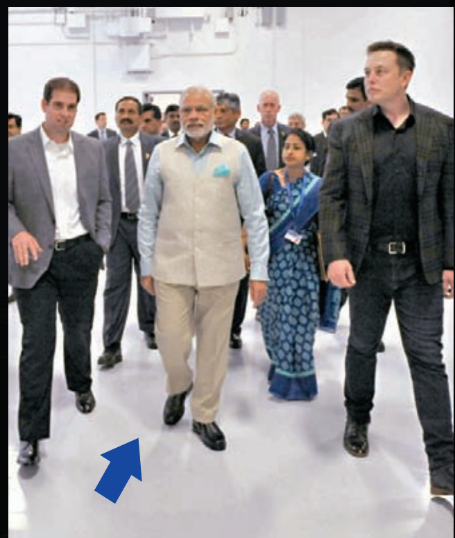
◆印度總理莫迪（箭頭示）曾到訪Tesla在加州的車廠，與馬斯克（右）會晤。