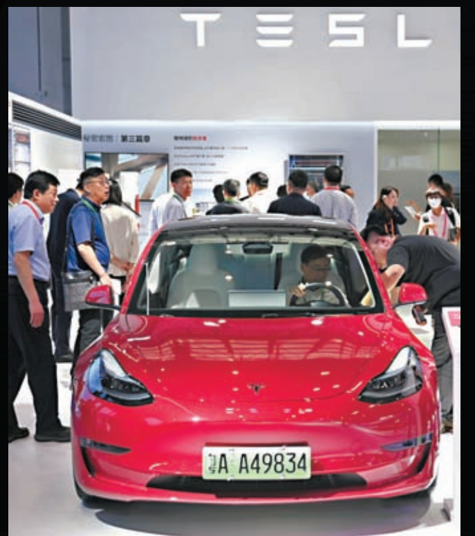
◆馬斯克將Tesla等旗下企業納入X平台決策的做法令人擔憂。資料圖片