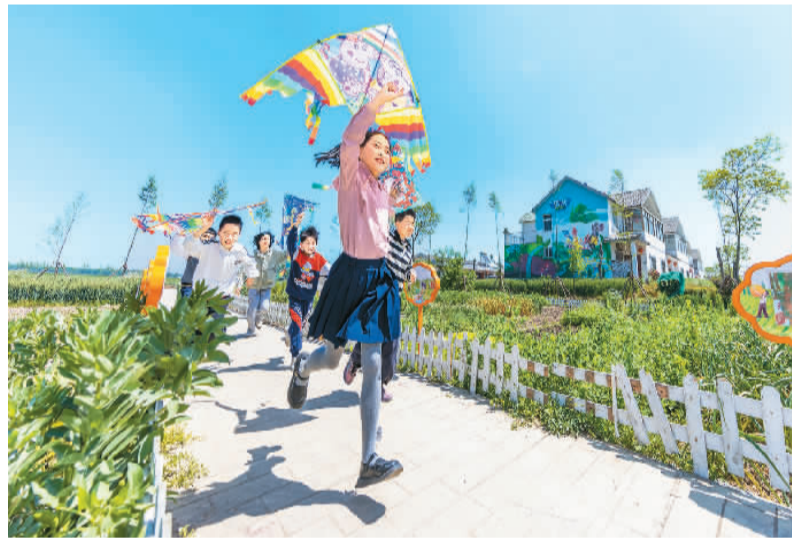
孩子们在江苏省泗洪县石集乡柳山新居“小菜园”放风筝。