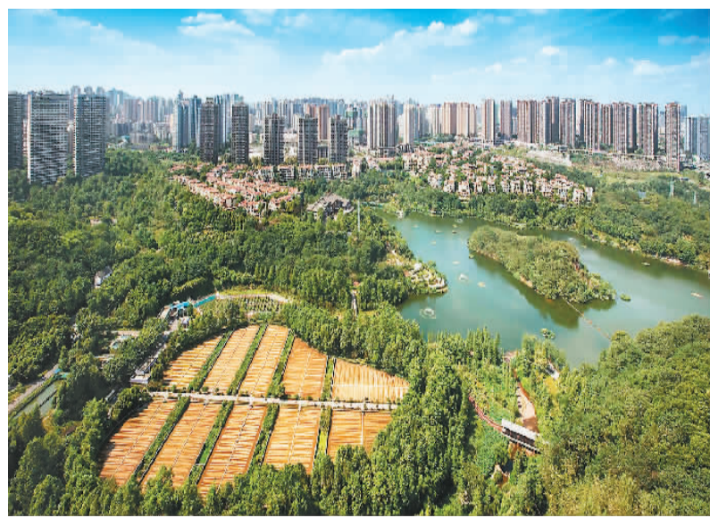
绿意盎然的彩云湖已成为人们了解山城重庆的又一窗口。