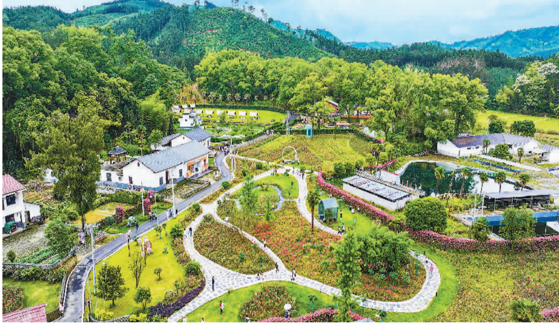
游客在江西省宜春市樟树镇五斗米农场休闲游玩。

来到北京市昌平区兴寿镇下苑村，游客可去旧书市集淘一本好书，也可走进“村咖”品一杯咖啡，或是实地走访艺术家工作室，体验高品质的乡村文化生活，如今已成为下苑村乡村旅游的一大“卖点”。