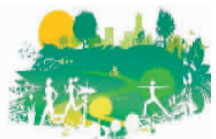
绿色旅游 美好生活

湖水清澈，花草繁茂，群鸟翻飞，四时景致……这片湖，是集污水处理、环境保护、观光游览、亲水观鸟、休闲健身及诗词楹联赏于一体的爽心悦情之地。