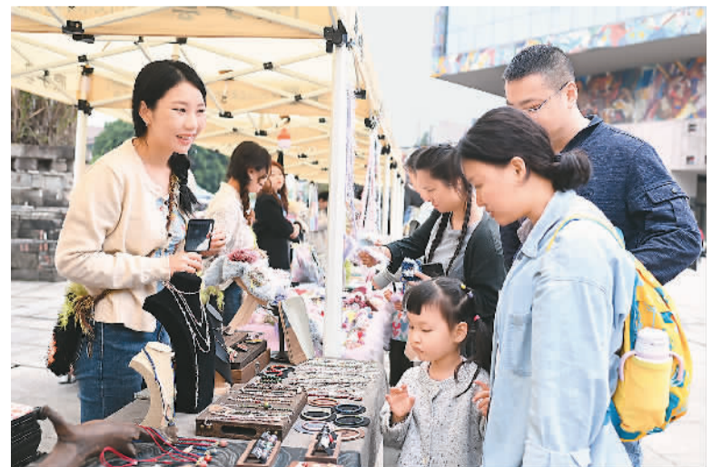
位于重庆市高新区虎溪街道的四川美术学院手工艺艺术原手工艺市集，每逢周末和节假日开集。集市提供摊位和基础配套，青年学子只需带上自己的创意产品即可“拎包创业”，展出并售卖首饰、陶艺等手工艺品。图为市民在该市集选购商品。

陕西省杂交油菜研究中心育种团队在含油量在40%左右的油菜出发，采用目标性状定向选育、生态穿梭选育、小孢子培养与品质性状选择相结合的技术方法，进行了大量的组合筛选，不断聚合高油基因，历经多年科研努力，最终获得含油量达66%的特高油油菜种质资源。