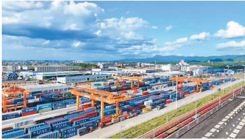
在江西省赣州市南康区，赣州国际陆港车来车往、货如轮转，起重机在装卸进出口货物集装箱。

“4月份，中国对新兴市场进出口持续向好，对欧美等传统市场进出口由降转增，加上较去年同期多2个