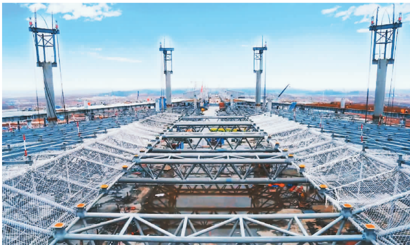
日前，长沙机场T3航站楼项目完成F大厅混凝土结构封顶。该项目由中建八局牵头联合体承建，总建筑面积约50万平方米，分为F区大厅及A、B、C、D、E区五条指廊，主楼共有4层。项目工程机坪规划近机位75个，可满足年旅客吞吐量4000万人次，是湖南省最大单体公共建筑工程。图为项目建设现场。