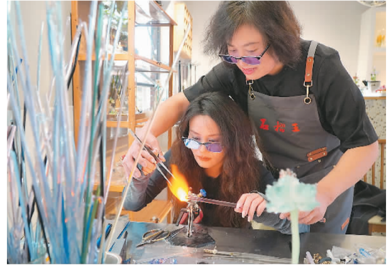
山东省淄博市博山区被誉为“中国琉璃之乡”，琉璃生产历史悠久。近年来，当地琉璃创作技法与产品样式不断创新，吸引了越来越多的关注，受到市场欢迎。图为5月9日，在博山区颜神古镇的“石榴王”手造琉璃坊，游客（前）体验琉璃灯制作工艺。