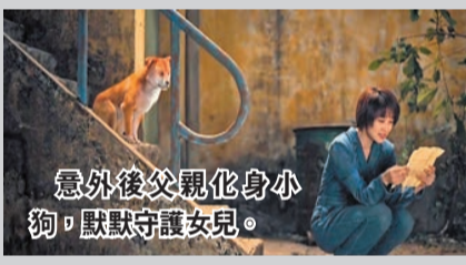
意外後父親化身小狗，默默守護女兒。