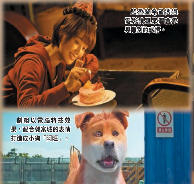
藍盈瑩希望透過電影讓觀眾體會愛與離別的情感。