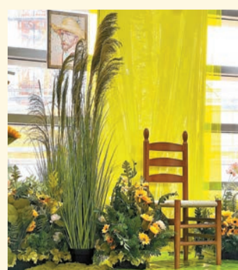
展覽重現《梵高的椅子》。