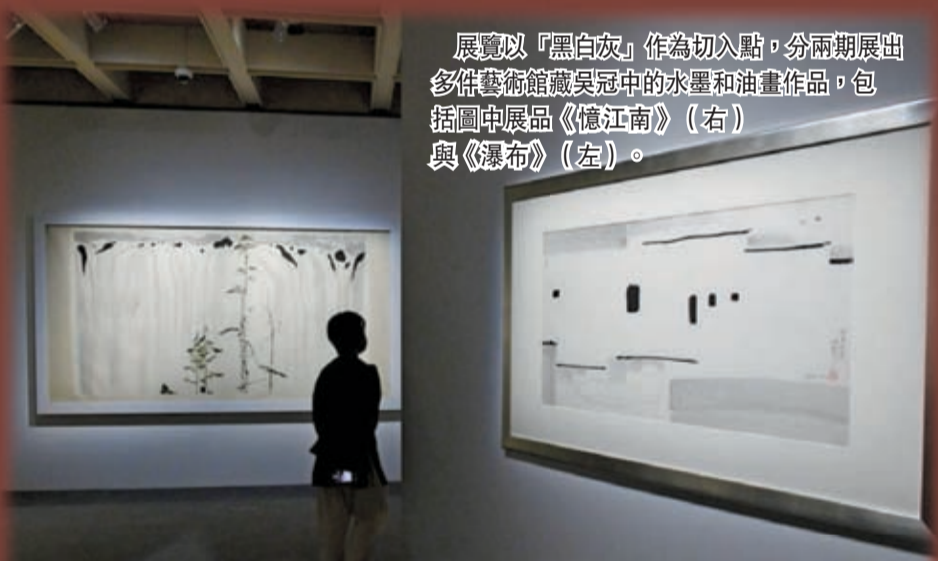
展覽以「黑白灰」作為切入點，分兩期展出多件藝術館藏吳冠中的水墨和油畫作品，包括圖中展品《憶江南》（右）與《瀑布》（左）。