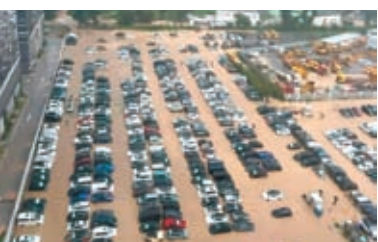
◆日出康城對開露天停車場嚴重水浸。

香港文匯報訊（記者蕭慕源）受「高空擾動」影響，香港同樣受到狂風暴雨侵襲，5月4日上午更發出今年首個紅色暴雨警告。其間，雷雨帶橫掃香港東部，西貢及將軍澳在早上一度錄得一小時內逾110毫米的雨量，以致區內處處澤國及發生山泥傾瀉，而日出康城領都對開露天停車場近300輛車更被水淹浸；有商場百貨公司因天花漏水暫停營業，西貢多名行山客因暴雨一度被困；長洲太平清醮搶包山比賽而搭建的3個包山棚架，被強風吹塌。截至當天晚上8時，將軍澳部分地區的雨量更超過400毫米。特區政府有關部門最少接到16宗水浸及15宗山泥傾瀉報告。