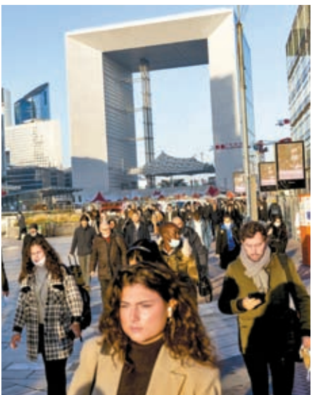
▶法國今年首季GDP雖按年增長1.1%，但當局近期已下調經濟增速預測。