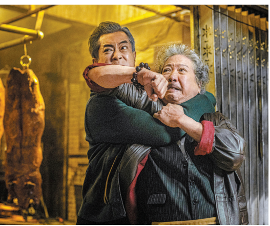
▲洪金寶與古天樂打得精彩！

港片《九龍城寨之圍城》在港首天開畫票房極速衝破500萬港元，一舉打破多項紀錄，成為2024年中西片單日開畫票房冠軍，更是近8年香港電影開畫日票房總冠軍，是歷年來香港電影開畫日票房第2位，僅次於2016年由《寒戰2》創下的開畫票房紀錄。同時，據貓眼專業版顯示，電影《九龍城寨之圍城》在截稿前內地的票房達1.81億元人民幣，與《維和防暴隊》、《末路狂花錢》暫列2024五一檔新片票房前三位，為低迷的港產片帶來一線曙光！