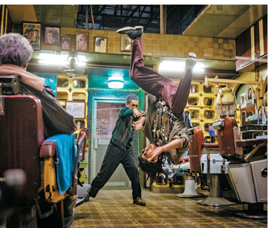
▲電影滲入漫畫式動作意念。