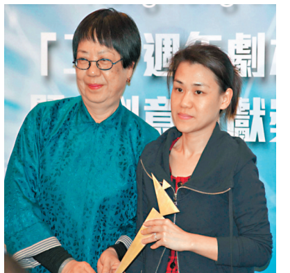
▲編劇歐健兒(右)曾創作不少受歡迎的電影作品。資料圖片

資料圖片 ▲編劇歐健兒(右)曾創作不少受歡迎的電影作品。資料圖片 電視台有資源，有月薪養新人，而且不停有工作，可以實戰，累積經驗，我因此可以留下來。但身邊亦都有很多前輩或後輩離開，因為編劇的工作，絕對是收入和付出不相稱的。要做得好，可能要全身投入，工作時間長或不穩定，有因為要養家轉行，亦有因為辛苦而轉行。電影編劇更艱難，因為是by project，一個項目搞幾年，隨時夭折，收不足錢；如果接幾檔增加收入，又可能無時間，亦都有機會做得不好，做不好，結果無人再搵你。」對於新晉編劇學徒計劃，她是歡迎的，但同時對計劃的效用有所保留：「18個月雖然不短，但對於一個編劇來說，其實不長，可能只可以夠時間，認清自己應不應該，或適不適當編劇。18個月只是開會度稿寫稿，作用其實也不大，因為寫了都無用、不能製作，無觀眾或市場話你知道你為寫的東西得唔得，所以除了訓練班外，可以幫到的可能是增加產量，讓更多人可以留低、生存、自我汰弱留強。《九龍城寨》票房報捷，當然開心，與有榮焉。這些大製作千載難逢，不同單位的製作人員都想參與，但機會不多。」