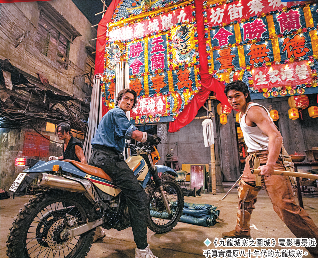
◆《九龍城寨之圍城》電影場景近乎真實還原八十年代的九龍城寨。

香港文匯報訊（記者 凡文、梁靜儀）港產小說漫畫動作電影《九龍城寨之圍城》五一在內地與香港同步上映，齊創佳績，內地的票房突破一億元人民幣！有內地觀眾以「漫改港片、銀河傳承、癡狂過火」來形容《九龍城寨之圍城》，電影上映後反響佳，「九龍城寨港片回來了」更衝上微博熱搜。同時香港電影業界近年積極培養人才，為改善香港電影創作人才出現斷層的情況，2日香港電影工作者總會宣布推出「新晉編劇學徒計劃」，培養新一代編劇的才華和創作能力，並相信這將為香港電影業帶來更多的優秀作品和編劇生力軍，推動香港電影行業的發展。