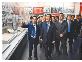
馬英九早前在中國人民抗日戰爭紀念館參觀。

今次國家主席習近平與馬英九相談甚歡，據談了一個小時，可以說是9年前在新加坡馬會的另一篇章，讓台灣青年親身感受到兩岸一家親的歷史根源，自己不僅是台灣人也是中國人！我認為，大陸以大事小，為兩岸和平統一，做出最大的努力和誠意。我相信當兩岸統一的那一天，只要是炎黃子孫都會落淚，又豈是馬英九一人。