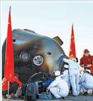
◆現場醫監醫保人員確認航天员湯洪波、唐勝傑、江新林身體狀態良好，神十七號人飛行任務取得圓滿成功。