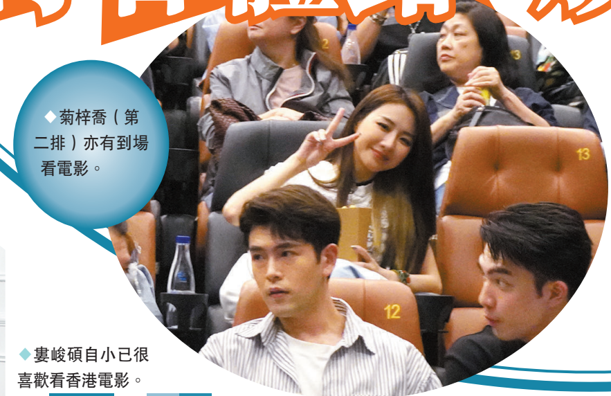
◆ 婁峻碩自小已很喜欢看香港電影。