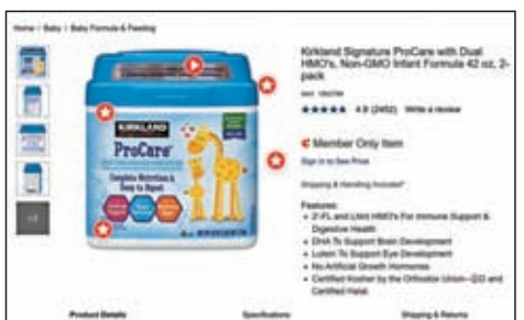
◆Costco旗下嬰兒配方奶粉普及，限制會員訂購數量。