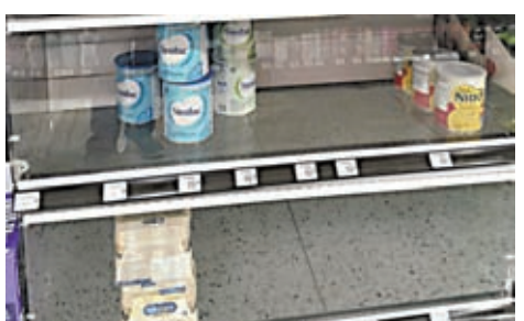
◆加拿大嬰兒配方奶粉供不應求，貨架常見缺貨。

香港文匯報訊(特約記者 成小智 多倫多報道)加拿大各地持續面對嬰兒配方奶粉供不應求，導致平均價格自2022年2月以來已上漲30%，令到很多基層家庭難以負擔，被迫勒緊褲頭減少日常開支來買奶粉。最近兩個月，中價配方奶粉經常在商店貨架上消失，家長唯有轉買名牌配方奶粉。