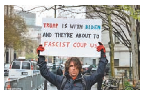
◆阿扎里洛日前手持標語示威，寫有「特朗普和拜登是同夥，他們準備發動法西斯政變。」