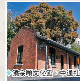
◆饒宗頤文化館。

饒宗頤文化館建築群位於九龍荔枝角青山道800號，距離港鐵美孚站僅有8分鐘的路程。從十九世紀末開始，饒宗頤文化館現址先後成為海關分廠、華工屯舍、檢疫站、監獄、傳染病醫院和精神病療養院等等。儘管角色不同，用途迥異，全都是回應當時社會的需要。如今文化館內設有藝術館、保育館、展覽館、博雅堂、「天光雲影」等景點，並於星期五、六免費提供「文化館活化之旅」導賞服務，講解文化館現址的歷史變遷和建築特色。值得一提的是，館內還建有「文化旅館·翠雅山房」供旅客住宿，體驗置身城市綠洲的樂趣。