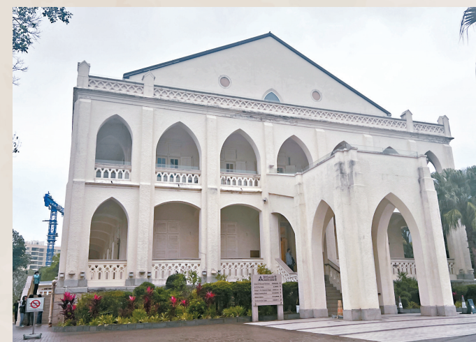
◆伯大尼修院具新哥德式建築風格。

伯大尼修院於1875年由法國外方傳道會興建，是傳道會在東亞地區首間療養院，為罹患熱帶疾病的傳教士提供休養的地方，待他們康復後返回各自的傳教區。伯大尼修院自1875年建成至1974年關閉期間，共接待了約6,000名傳教士，是法國天主教會在東亞地區從事傳道工作的重要地點。伯大尼修院其後由政府接管，並於1978至1997年期間被租予香港大學使用。2002年，政府決定將伯大尼修院租予香港演藝學院，改建為其校舍。