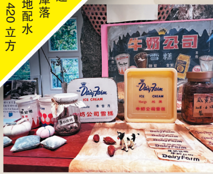
◆牧場內展出牛奶公司當年的乳品容器、海報等。