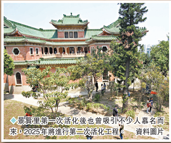
◆景賢里第一活化後也曾吸引不少人慕名而來，2025年將進行第二次活化工程。