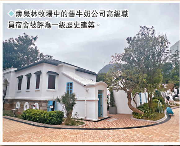
◆薄島林牧場中的舊牛奶公司高級職員宿舍被評為一級歷史建築。