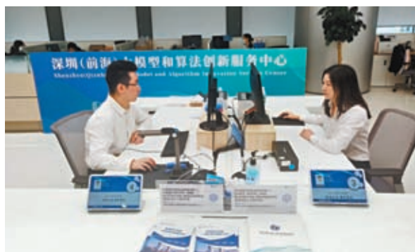
◆前海是港澳青年北上的熱門選擇。深圳(前海)大模型和算法創新服務中心幫助企業快速推進大模型與算法的研發和上市，令公司平穩度過發展期。

此外，財政部、稅務總局還印發實施《關於前海深港現代服務業合作區企業所得稅優惠政策的通知》，明確將前海15%企業所得稅優惠政策實施範圍擴展至合作區全域。