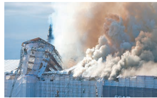
丹麥舊證交所56米高的螺旋型尖塔被燒至倒塌。

國家博物館通報稱，國家博物館的25名人員正在前往老證券交易所的途中。這些人員負責後勤、保護物品、管理員和警衛。文化部長恩格爾施密特對不少人伸出援手，協助搬走火場內的藝術珍品，表示感謝。