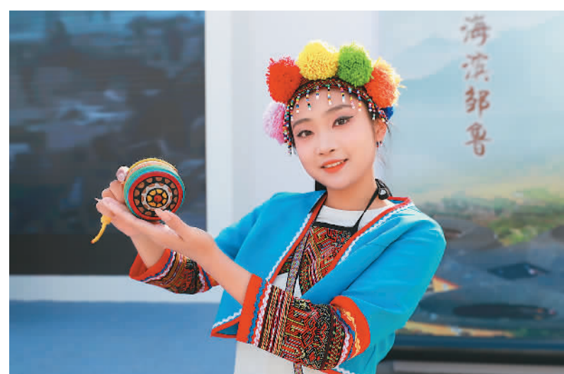
4月18日，由福建省承办的“中华民族共同体体验馆——福建体验馆”在北京举办，通过“簪花装扮”“寻福记”“大漆漂染”“中国白瓷”“大众茶馆”等生动展演、趣味体验，让观众直观感受中华文化的多元一体。图为福建非遗项目展示——陀螺。

本次乒乓球世界杯赛制迎来新变化，人数由男子、女子各16人扩展至各48人，比赛分为两个阶段。15日至17日进行小组赛，男、女球员各分成16组进行“4局制”比拼，小组第一晋级16强淘汰赛。