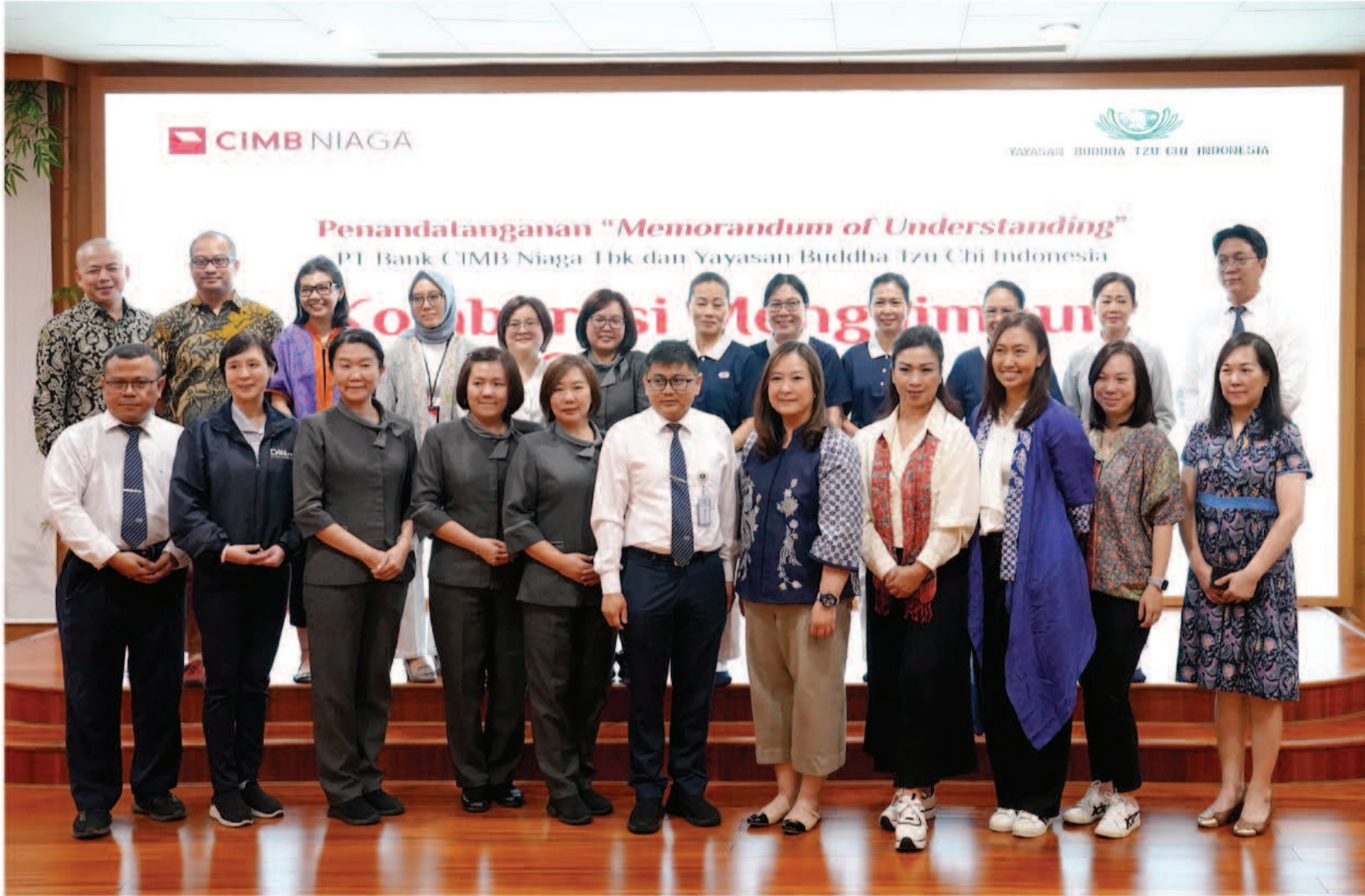
2024年4月18日，联昌商业银行（CIMB Niaga）与慈济正式签署合作备忘录，开启慈济在联昌商业银行的捐款服务。