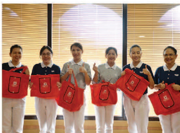
志工也来参与备忘录签署，大家都十分欢喜，未来可以让更多社会善士护持慈济。