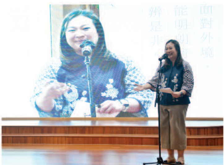
露西安娜向大家分享一开始因为对慈济的好奇心，才孕育出和慈济合作的主意，让民众方便捐款护持慈济。