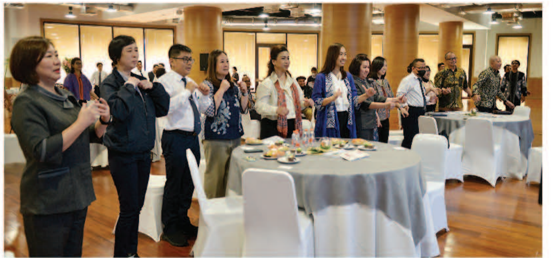
在台下的志工、同仁与嘉宾大家一起比《一家人》手语。