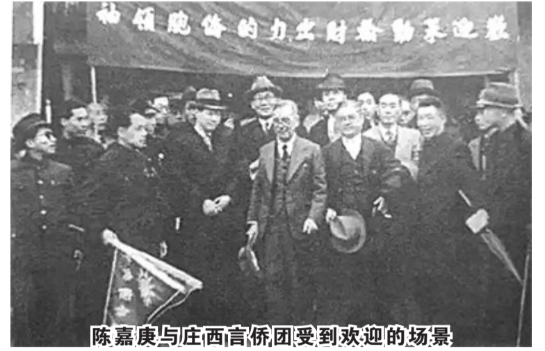
陈嘉庚与庄西言侨团受到欢迎的场景