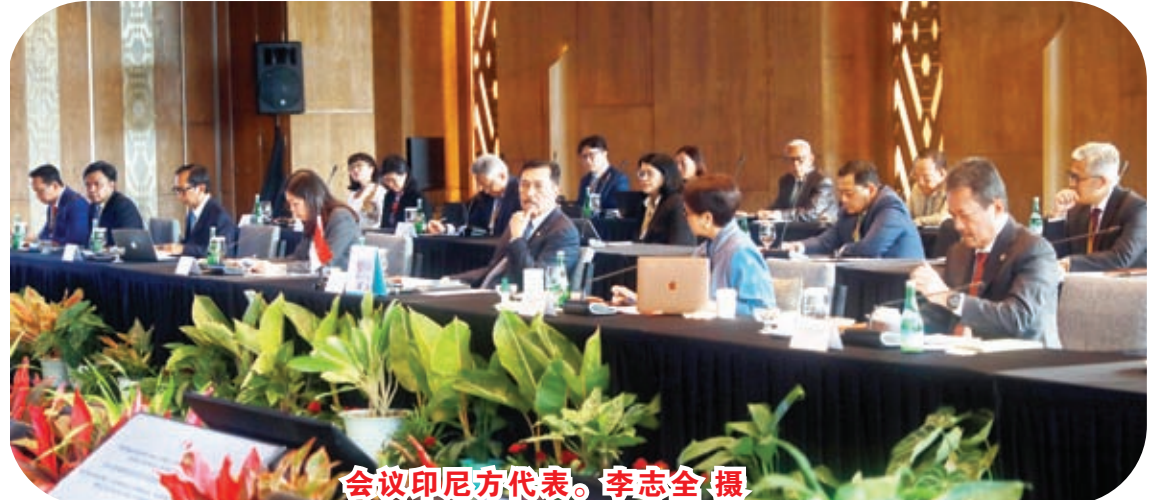
会议印尼方代表。