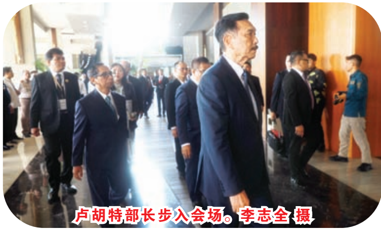
卢胡特部长步入会场。