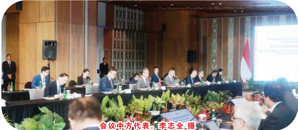
会议中方代表。