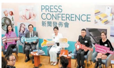
貿發局舉行記者會公布相關內容。

【香港商報訊】記者葉家亨報道：香港貿易發展局本月下旬將舉辦7項涵蓋時尚潮流、生活用品及授權領域的活動，當中包括6項展覽及1項會議。展覽部分雲集來自約30個國家及地區、超過7000家展商，帶來家品、時裝、禮品、印刷及包裝、授權項目等多個範疇的產品、品牌及項目。