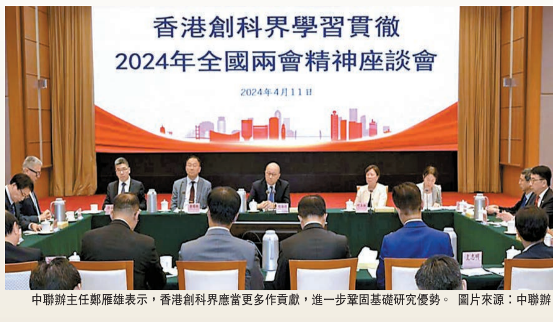
中聯辦主任鄭雁雄表示，香港創科界應當更多作貢獻，進一步鞏固基礎研究優勢。

務。要把握好發展新質生產力、鞏固提升國際金融中心地位、統籌高質量發展和高水平安全的香港擔當，把握好香港由治及興的創科擔當。習近平總書記強調發展新質生產力，是對中國經濟提質升級的把脈定向，也切中了香港的迫切需要。發展新質生產力、推動高質量發展，科技工作者有更寬廣的天地、更重要的使命。香港創科界應當更多作貢獻，進一步鞏固基礎研究優勢，進一步以科技創新賦能產業創新，進一步融入國家發展大局，進一步提升國際化水平，進一步匯聚全球優秀人才，讓發展新質生產力、推動高質量發展成為香港由治及興進程中的生動實踐。