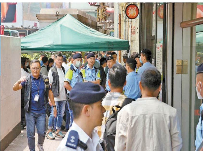
因應佐敦道華豐大廈日前火警事故的事後工作，油尖旺民政事務處昨日在該大廈外設立跨部門援助站，聯同警方、消防處、社會福利署及香港旅遊發展局為市民提供適切協助。

【香港商報訊】記者葉家亨、區天海報道：發生5死40傷大火的佐敦道華豐大廈昨日仍未解封，居民昨日取回個人物品，部分入住臨時庇護中心，至今仍有8名傷者留院，當中7人危殆。消防指，大廈曾改動內部結構，增加救援困難；油尖旺區議員亦指7年前曾與大廈法團溝通，曾多次提醒法團要遵從屋宇署命令，提升防火保障但遭拒絕。