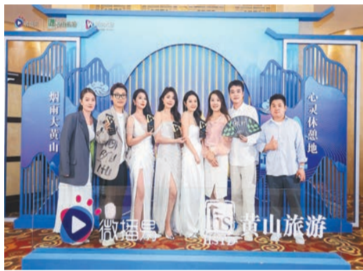
大會舉辦的風向之夜·頒獎盛典。

【香港商報訊】記者吳敏報道：「2024年將是AI對內容產業影響最大的一年，擁抱AI，將會產生無限可能。」4月15日，由黃山市政府指導，北京微播易科技股份有限公司、黃山旅遊股份有限公司（600054.SH）主辦的第八屆社交媒體風向大會暨頒獎典禮在安徽屯溪舉行。當天，MCN機構、社交媒體以及網紅達人近千人參加。