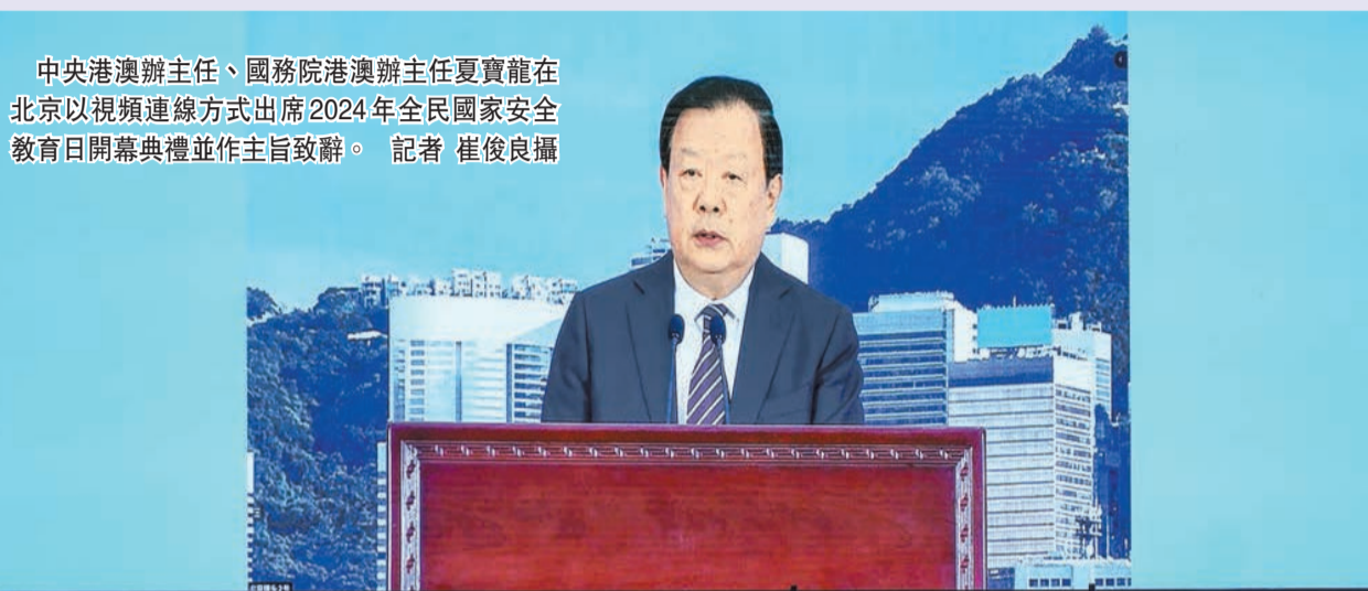
中央港澳辦主任、國務院港澳辦主任夏寶龍在北京以視頻連線方式出席2024年全民國家安全教育日開幕典禮並作主旨致辭。

【香港商報訊】記者馮仁樂報導：昨日上午，香港特區維護國家安全委員會舉辦2024年「全民國家安全教育日」開幕典禮，中央港澳工作辦公室主任、國務院港澳事務辦公室主任夏寶龍和港澳辦領導班子成員在北京以視頻連線方式出席開幕典禮。夏寶龍作主旨致辭，對香港實現由治及興提出五點看法，表示中央全力支持香港實現由治及興，更多挺港惠港措施陸續有來。（尚有相關報道刊A3版）