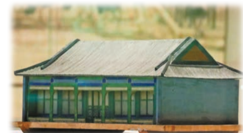
「圓明園九洲清晏殿燙樣」，清同治十二年