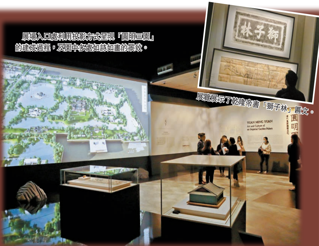
展場入口處利用投影方式呈現「圓明三園」的建成過程，及園中多處如詩如畫的景致。