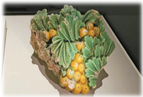
「建築裝飾構件」，約乾隆十二年至四十八年。