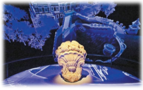
「雕花構件」，約乾隆二十一年至二十四年。