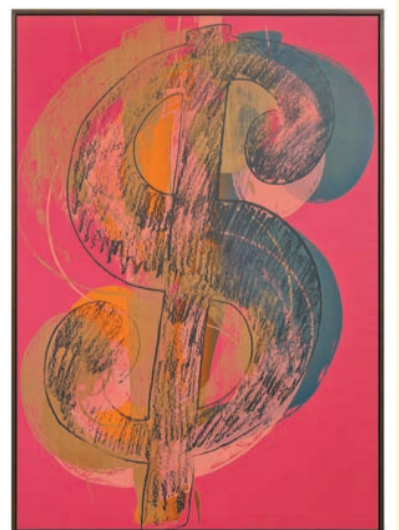
安迪·沃荷作品《美元符號》，1981年。