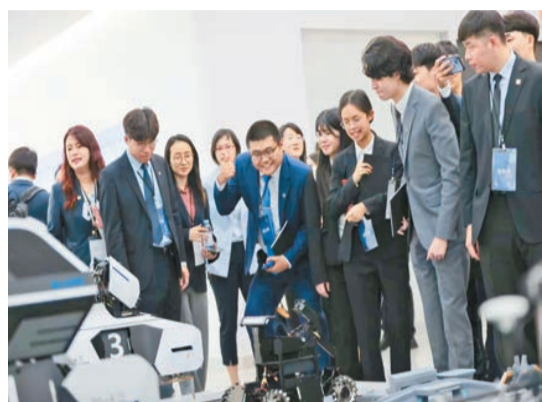
台灣青年與大疆機器人互動。

【香港商報訊】綜合消息，4月1日14時許，馬英九先生率20位台灣青年乘機抵達深圳寶安國際機場。馬英九一行下午首站前往大疆公司位於深圳的全球總部參訪，體驗輕薄無人機，隨後參訪騰訊公司。