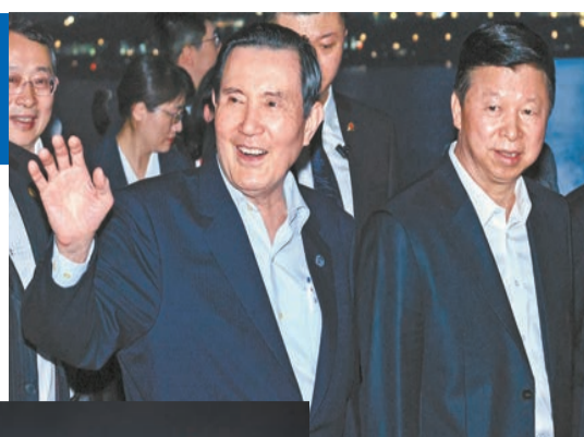
抵深當晚，馬英九在宋濤（右）等陪同下到深圳人才公園觀看無人機表演。