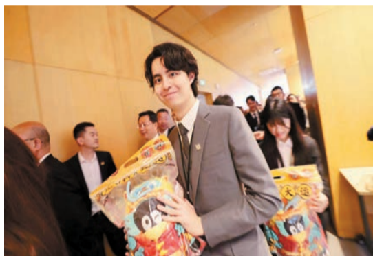
台灣青年收到騰訊公仔禮物。