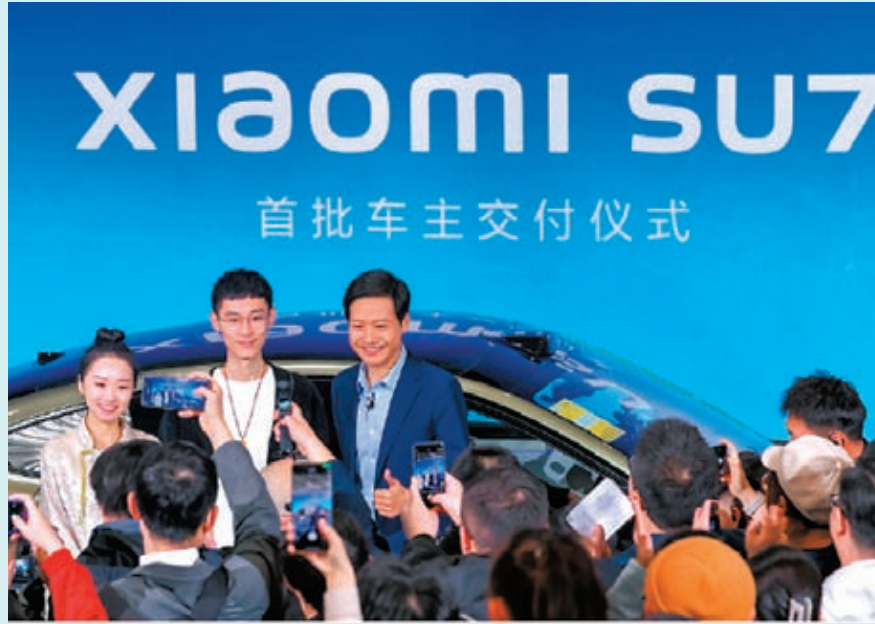
◆小米汽車SU7 3日舉行首批交付儀式，雷軍親自把車交給首批車主。 網上圖片

雷軍3日親自主持小米SU7首批交付儀式，並在現場宣布，小米SU7開售短短幾日時間，就有超過10萬人落大訂，鎖單量已經超過4萬單。他續表示，「這是一份沉甸甸的信任，我們一定要把產品做好、品質做好、服務做好，不辜負大家的信任。很多很多年以後，我們一定都還會一直記得今天：小米汽車正式登場，智慧汽車真正的變革正式開始，中國必將誕生像特斯拉一樣偉大的公司。」雷軍另發布與車主的合照，並指：「今年非常開心，親身把車交給了我們首批車主！」